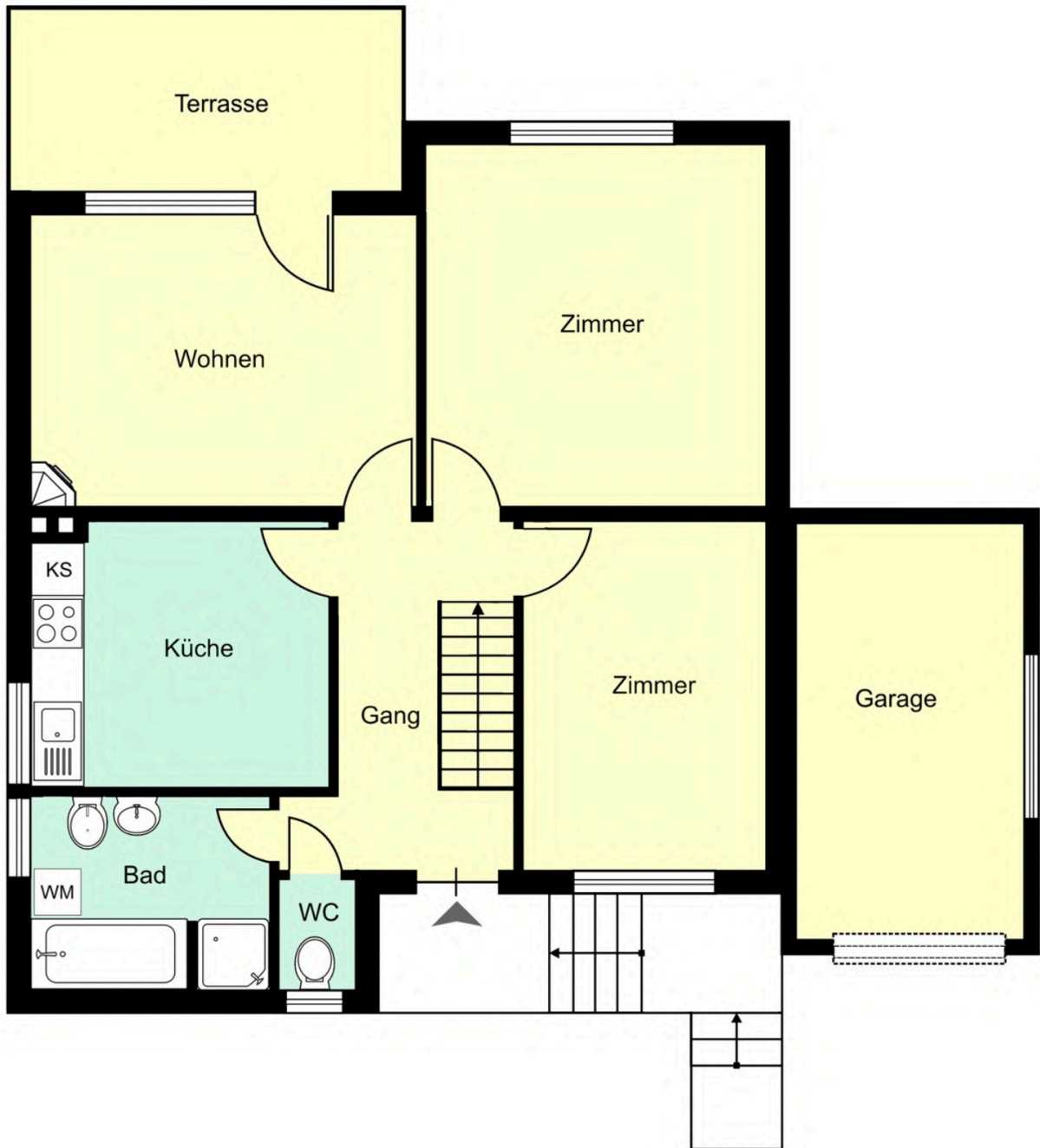
Grundriss Wohngeschoss ohne Maßstab