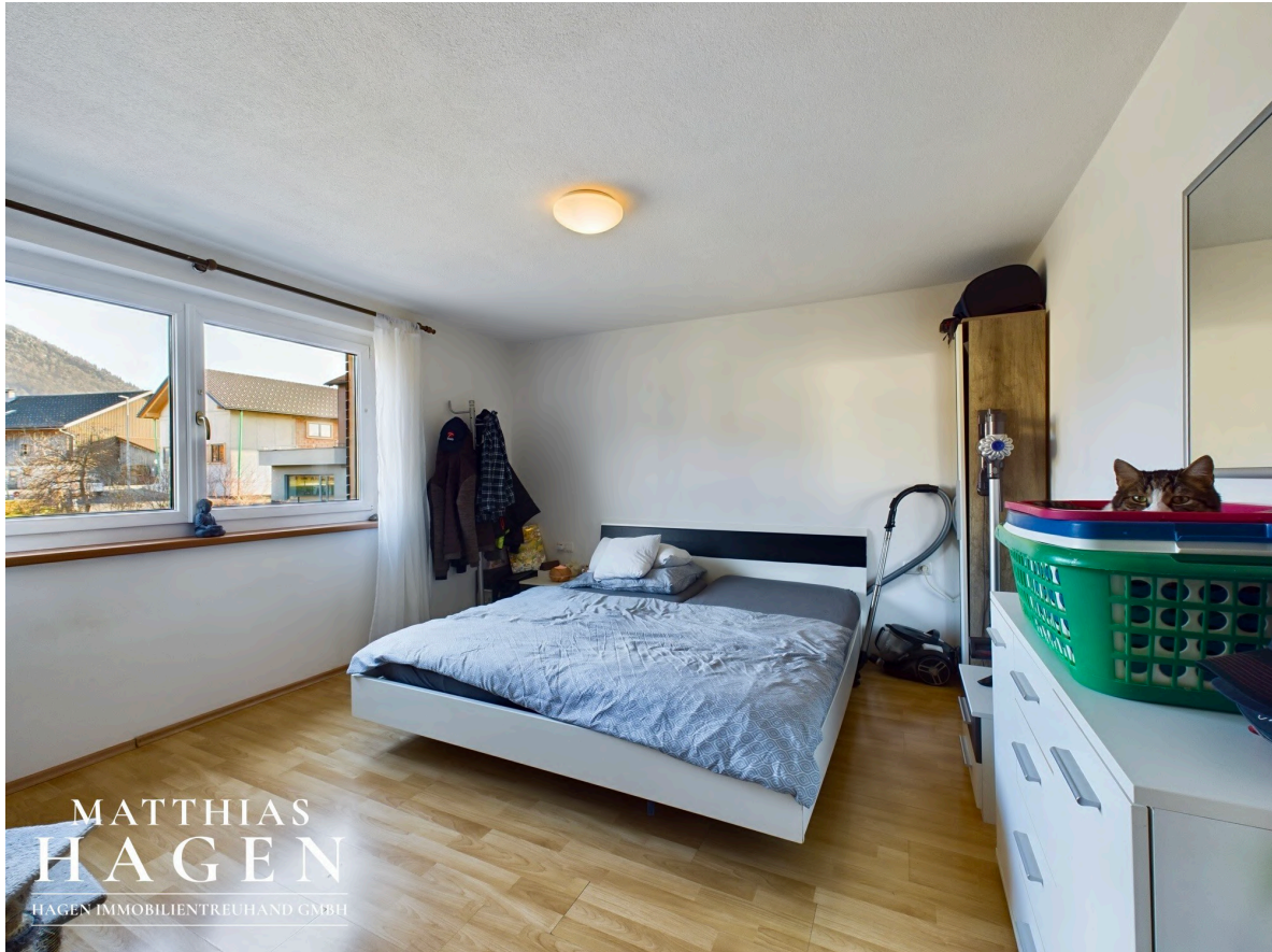
Zimmer 2 W3