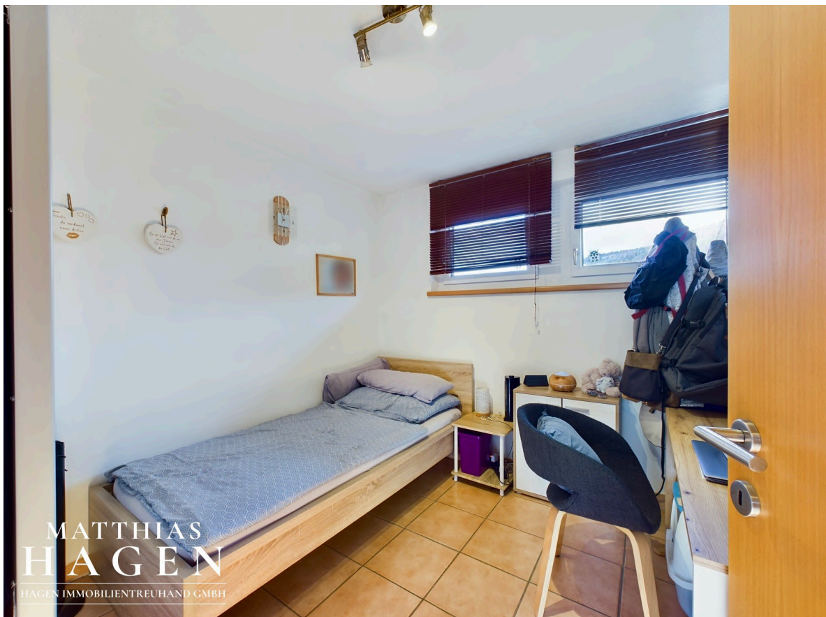
Zimmer 1 W3