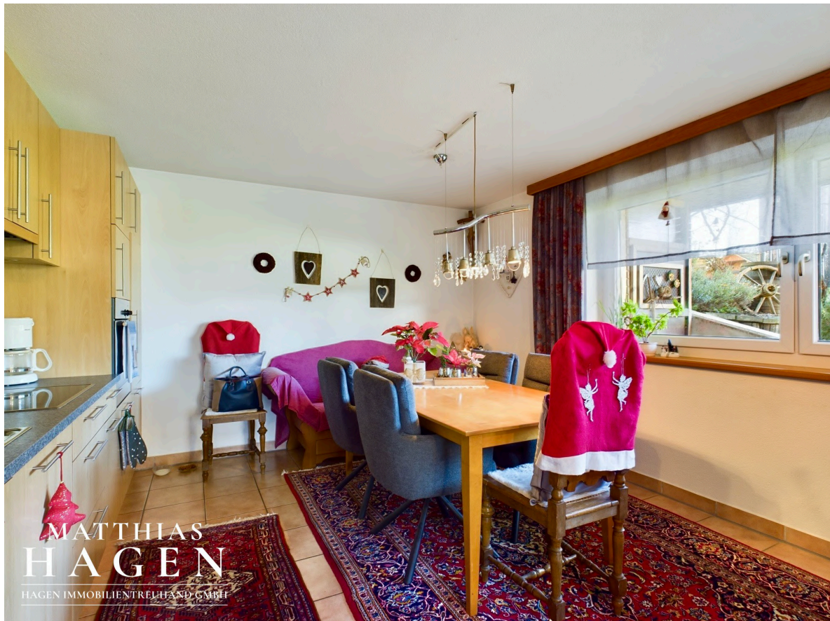
Wohnbereich / Küche W1