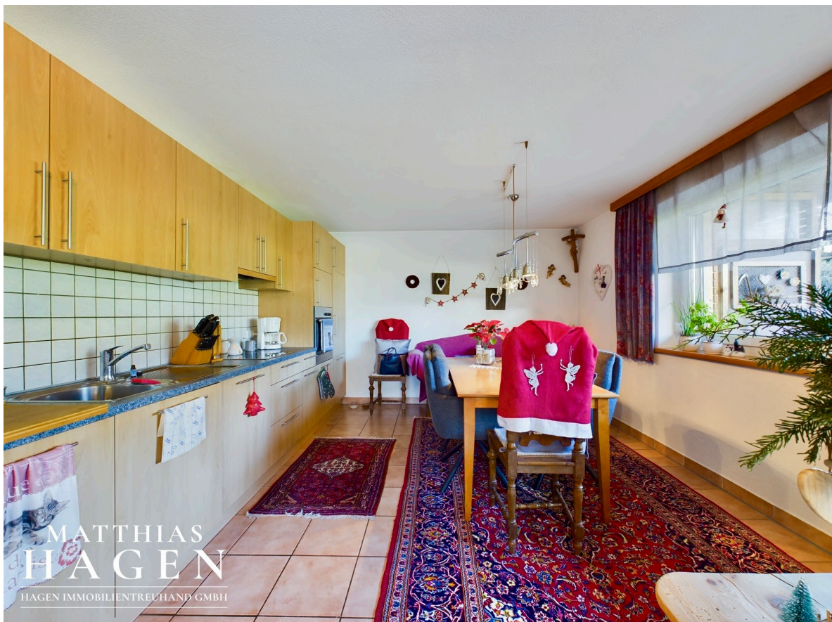
Wohnbereich / Küche W1