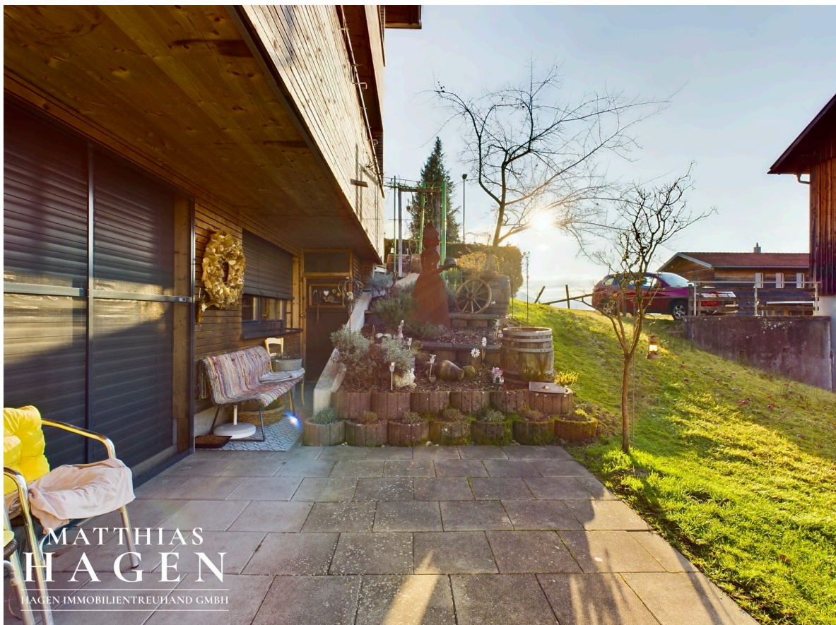
Zimmer 1 W1