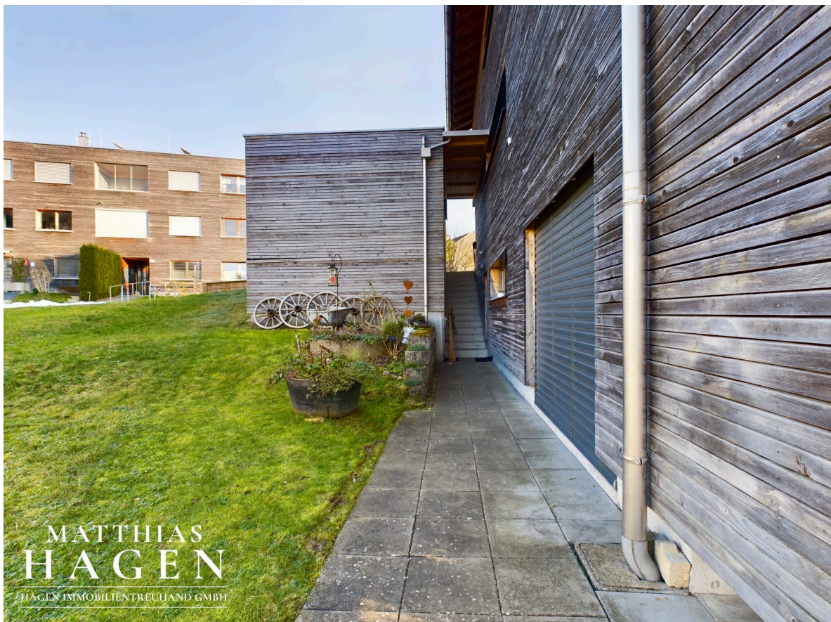
Zugang W1 von unten