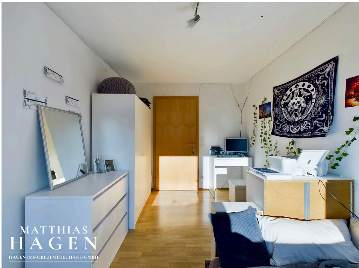
Zimmer 3 W3