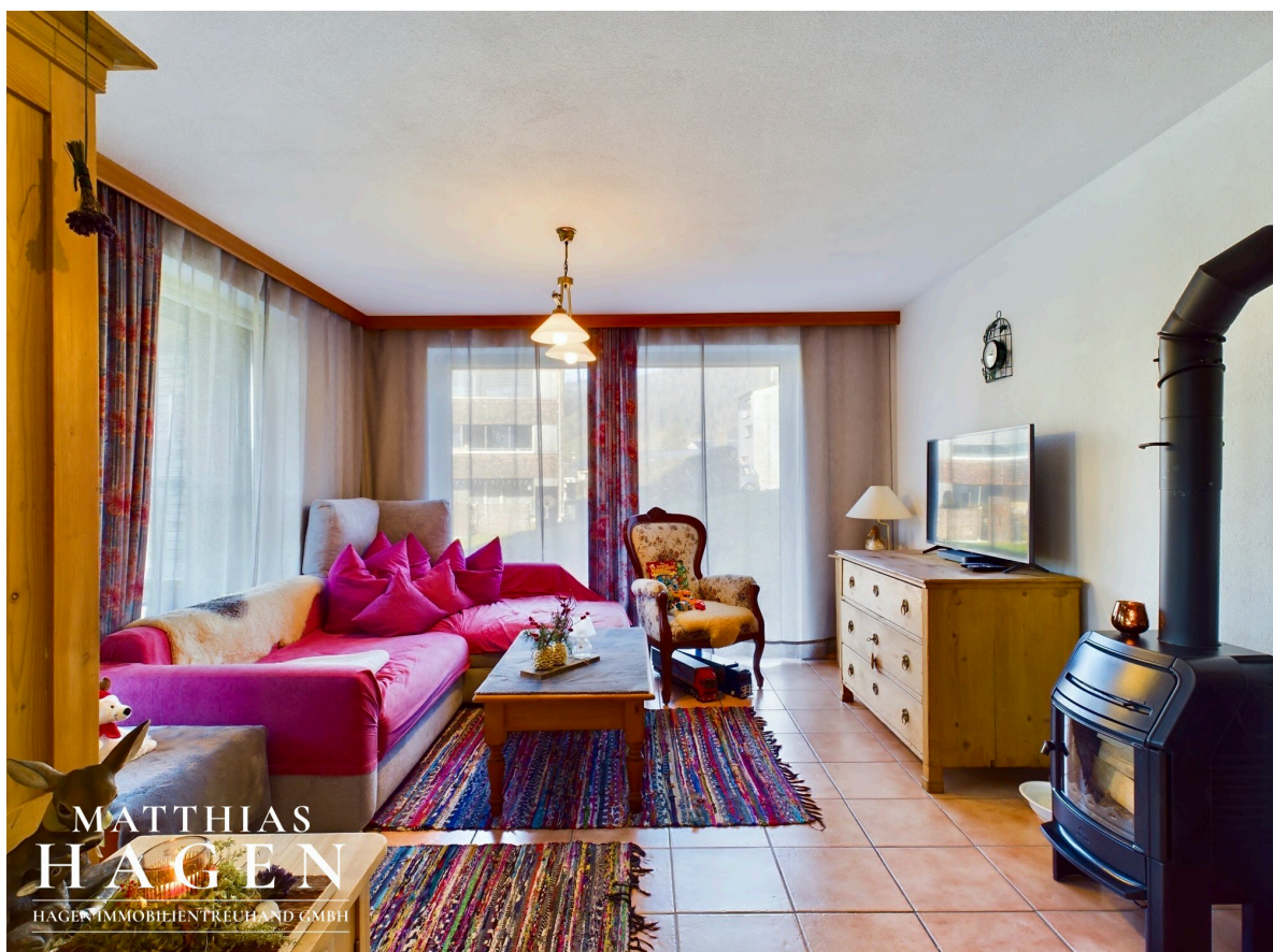
Wohnbereich / Küche W1