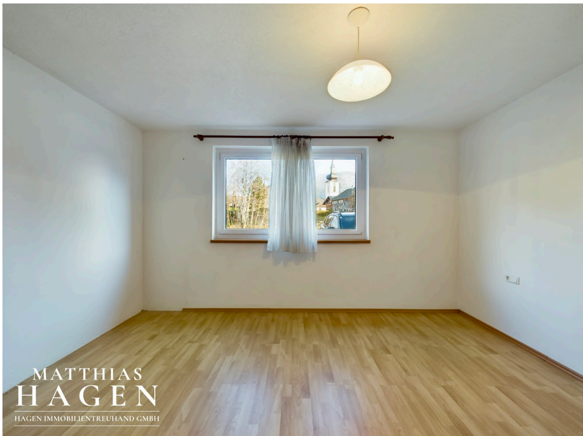
Zimmer 1 W2