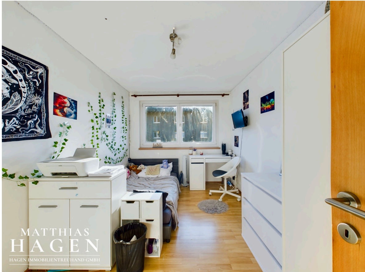
Zimmer 3 W3