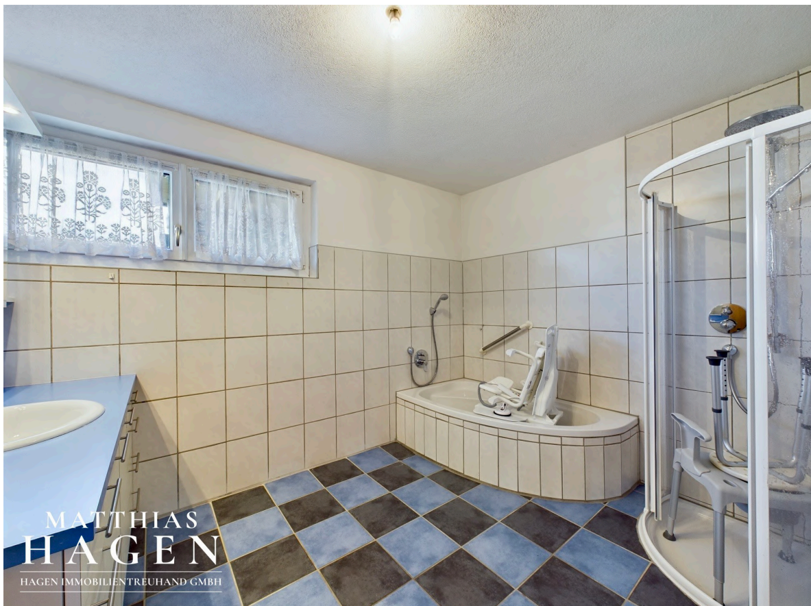
Zimmer 2 W2