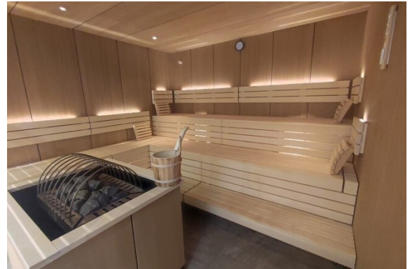
Sauna im EG