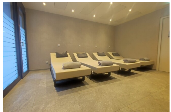
Sauna - Liege