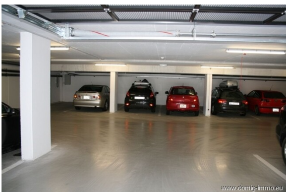
TG - Platz