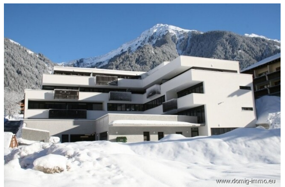
Südwest - WI