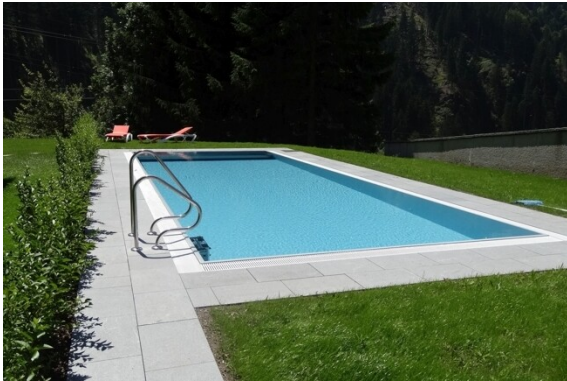
Pool für Hausgäste