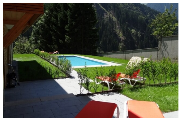
Pool im Best. Haus