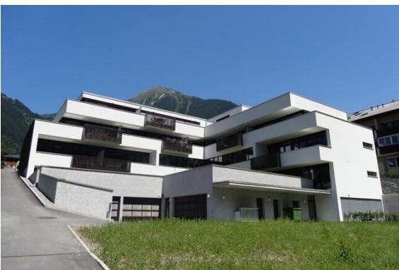
Südwest - SO