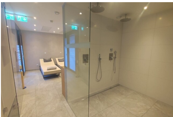
Sauna - DU