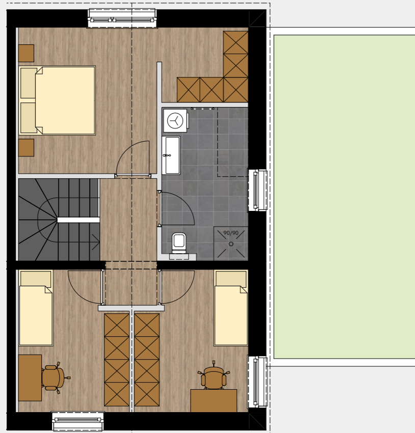
MÖBLIERUNGSBEISPIEL M 1:100

Die in den Plänen eingezeichneten Möbliervorschläge und dargestellte Bepflanzungen in den Außenanlagen und auf den Terrassen sind nicht im Lieferumfang des Bauträgers/Verkäufers enthalten. Flächenangaben basieren auf dem derzeitigen Planungsstand und können ausführungsbedingt geringfügig abweichen. Ansonsten gilt die Bau- und Ausstattungsbeschreibung. Änderungen vorbehalten. Für Möbel- und Kücheneinbauten sind Naturmaße zu nehmen.