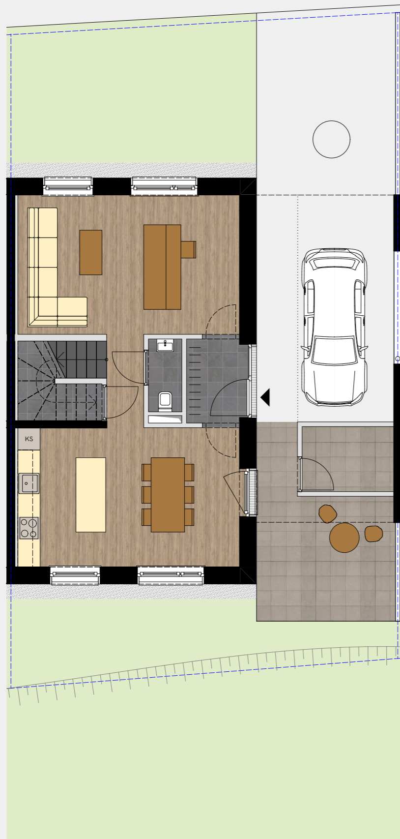
MÖBLIERUNGSBEISPIEL M 1:100