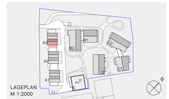
LAGEPLAN M 1:2000