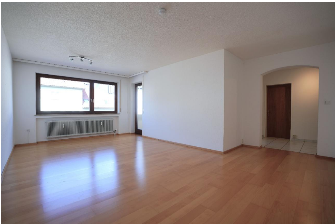
Wohnzimmer mit Zugang zum Balkon