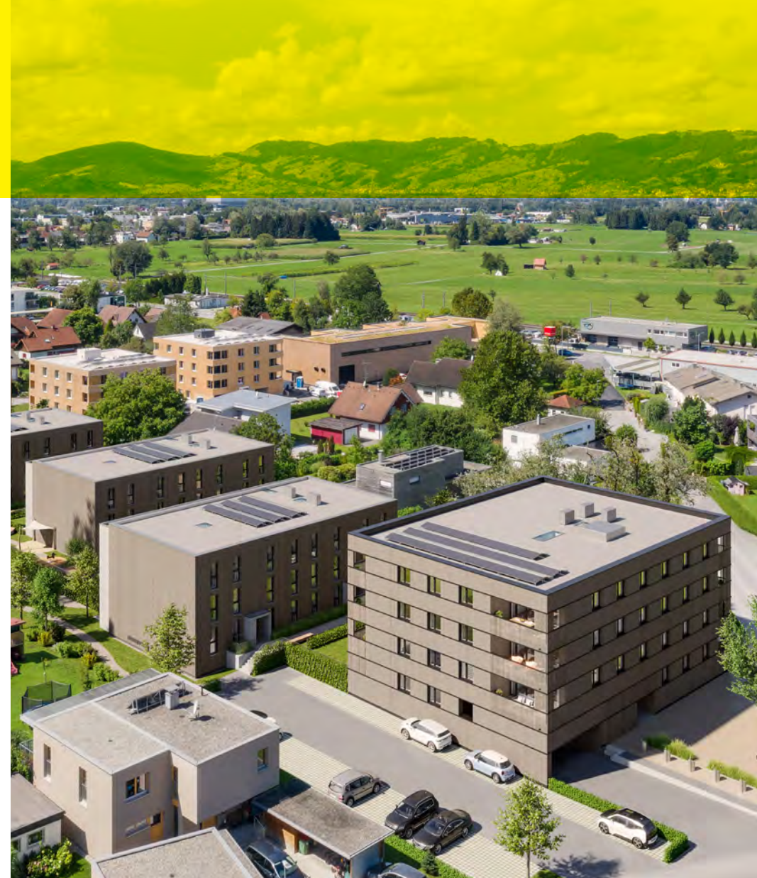
Zuhause in Hohenems Vorarlbergs jüngste Stadt ist besonders - ein historischer Stadtkern, urbane Infrastruktur und schöne Naherholungszonen.