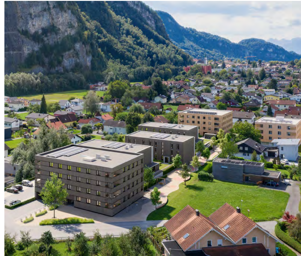
Spielweg Entlang der Bebauung entsteht ein Spielweg mit unterschiedlichen Spielgeräten.

Baumschlager Hutter ZT GmbH Schlossstraße 211 CH-9435 Heerbrugg