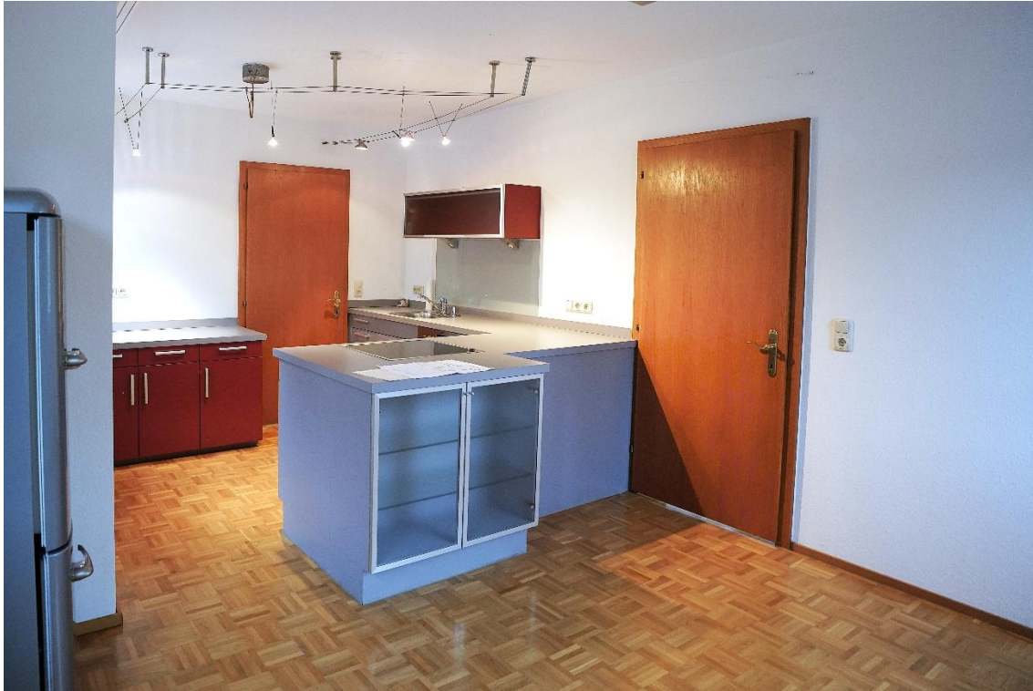
Küche / Essplatz