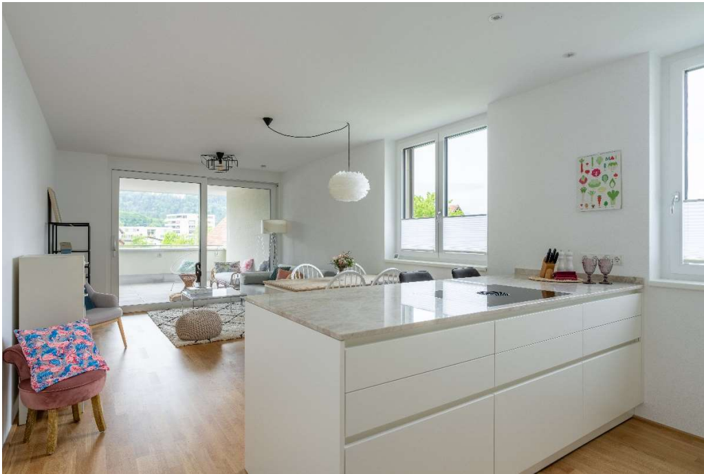
Wohnen & Kochen