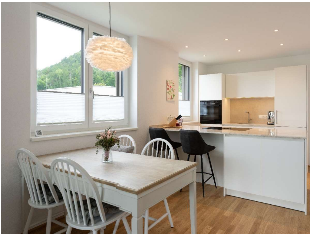
Kochen & Essen