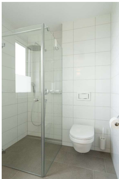
Dusche & WC