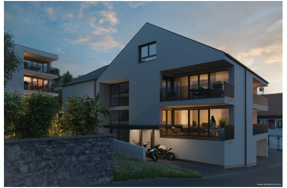
Ansicht | Haus 1+2