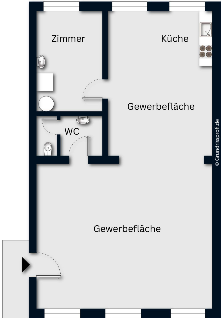
Grundriss ohne Maßstab