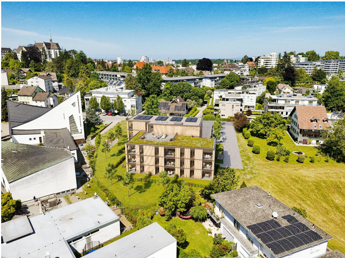
Harmonisch in das Umfeld eingepasst