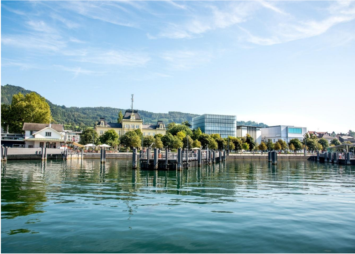
Die Seeanlagen nicht weit entfernt