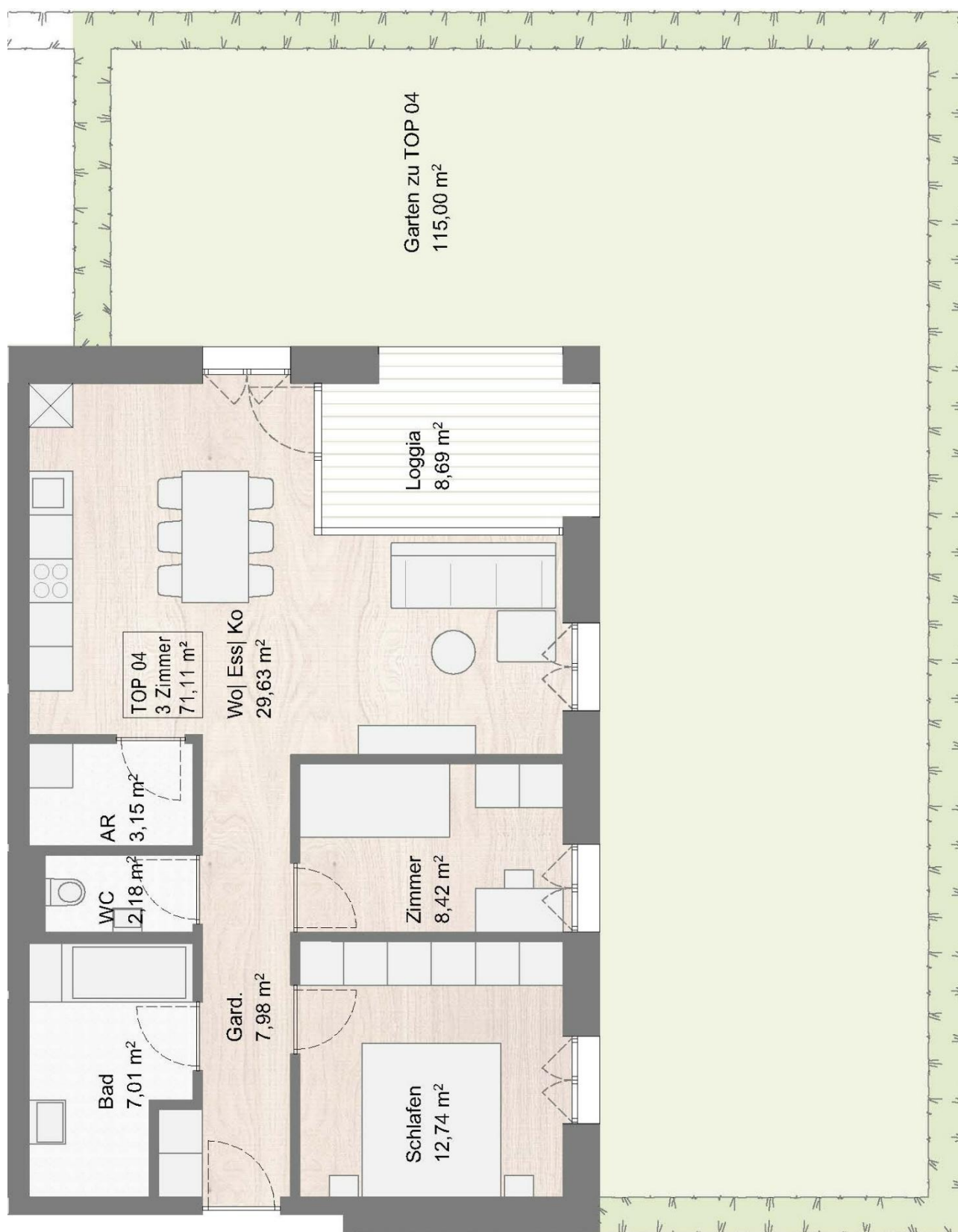
Grundriss Top 4, EG