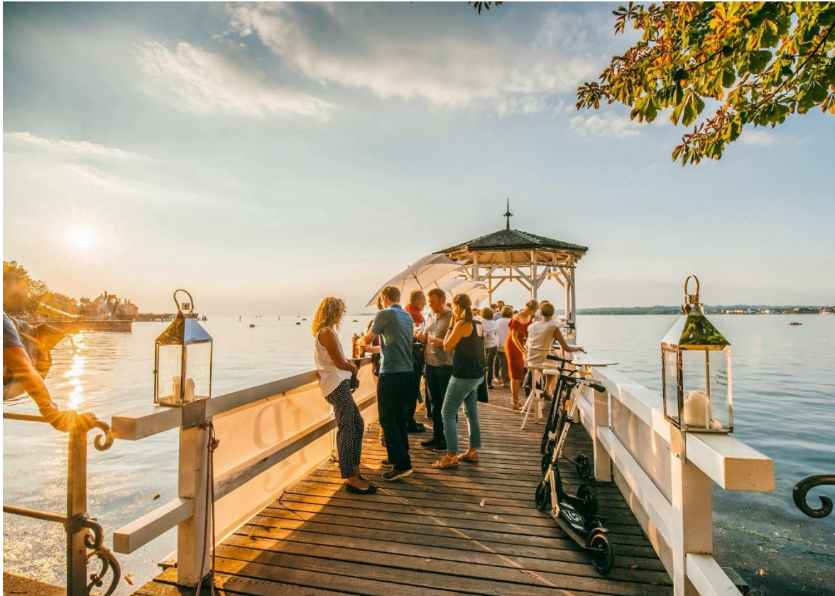
Sun-downer am Fischersteg