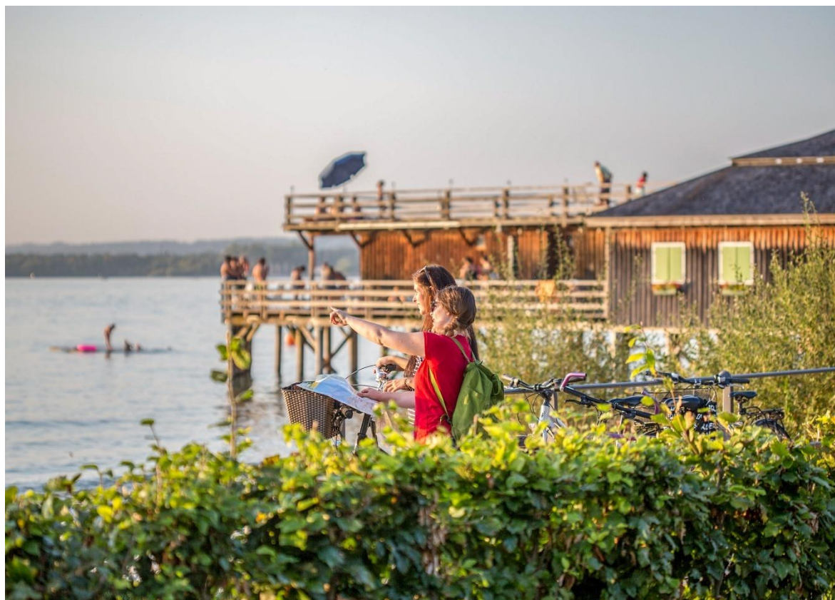
Per Fahrrad zum Mili.....