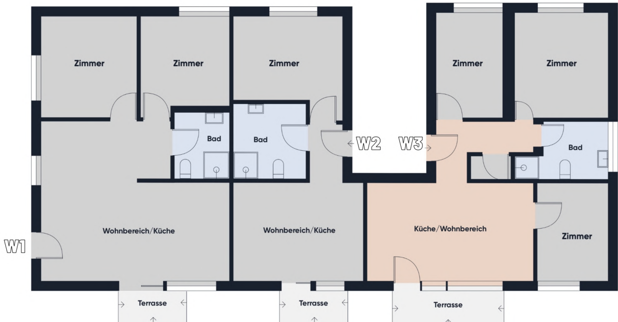
Grundrissplan ohne Maßstab EG