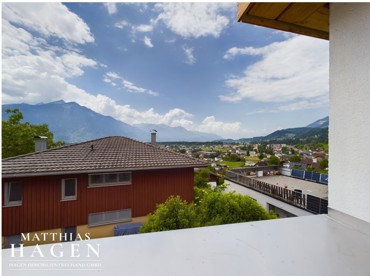
Ausblick Terrasse W4-1