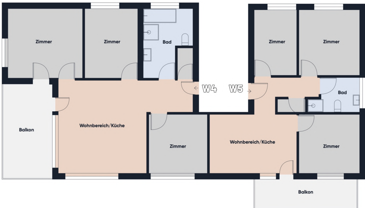
Grundrissplan ohne Maßstab OG