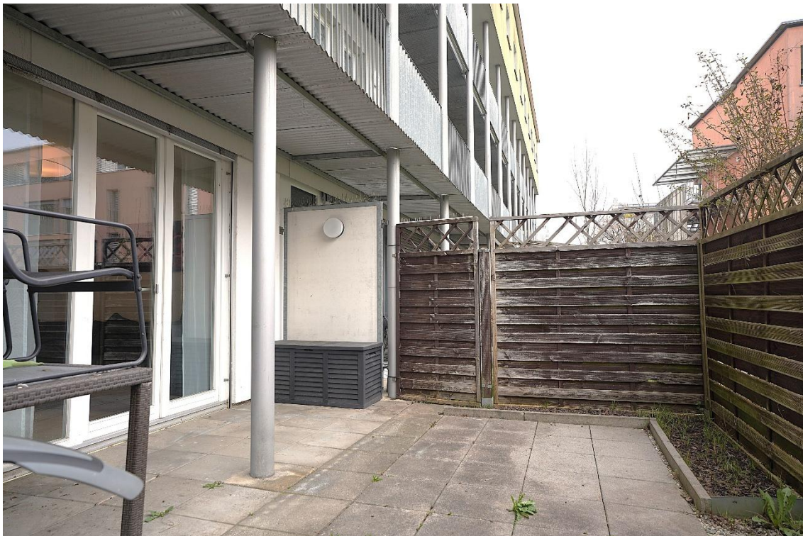
Garten mit Terrasse