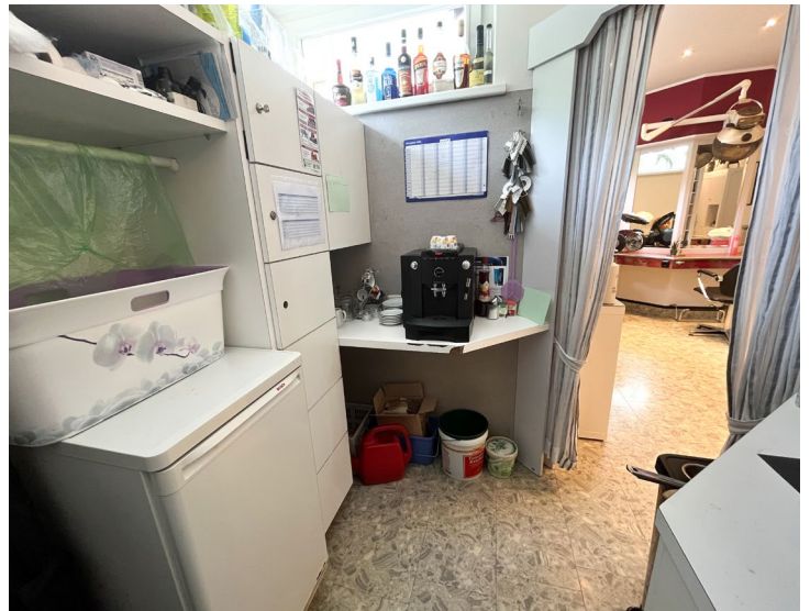
Farblabor und Abstellmöglichkeiten