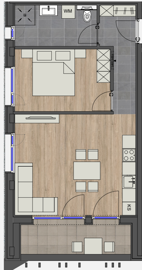
WOHNBEISPIEL M 1/100