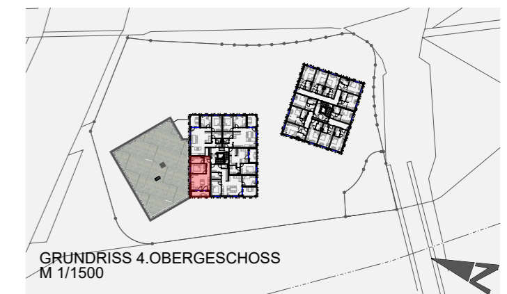
GRUNDRISS 4.OBERGESCHOSS M 1/1500