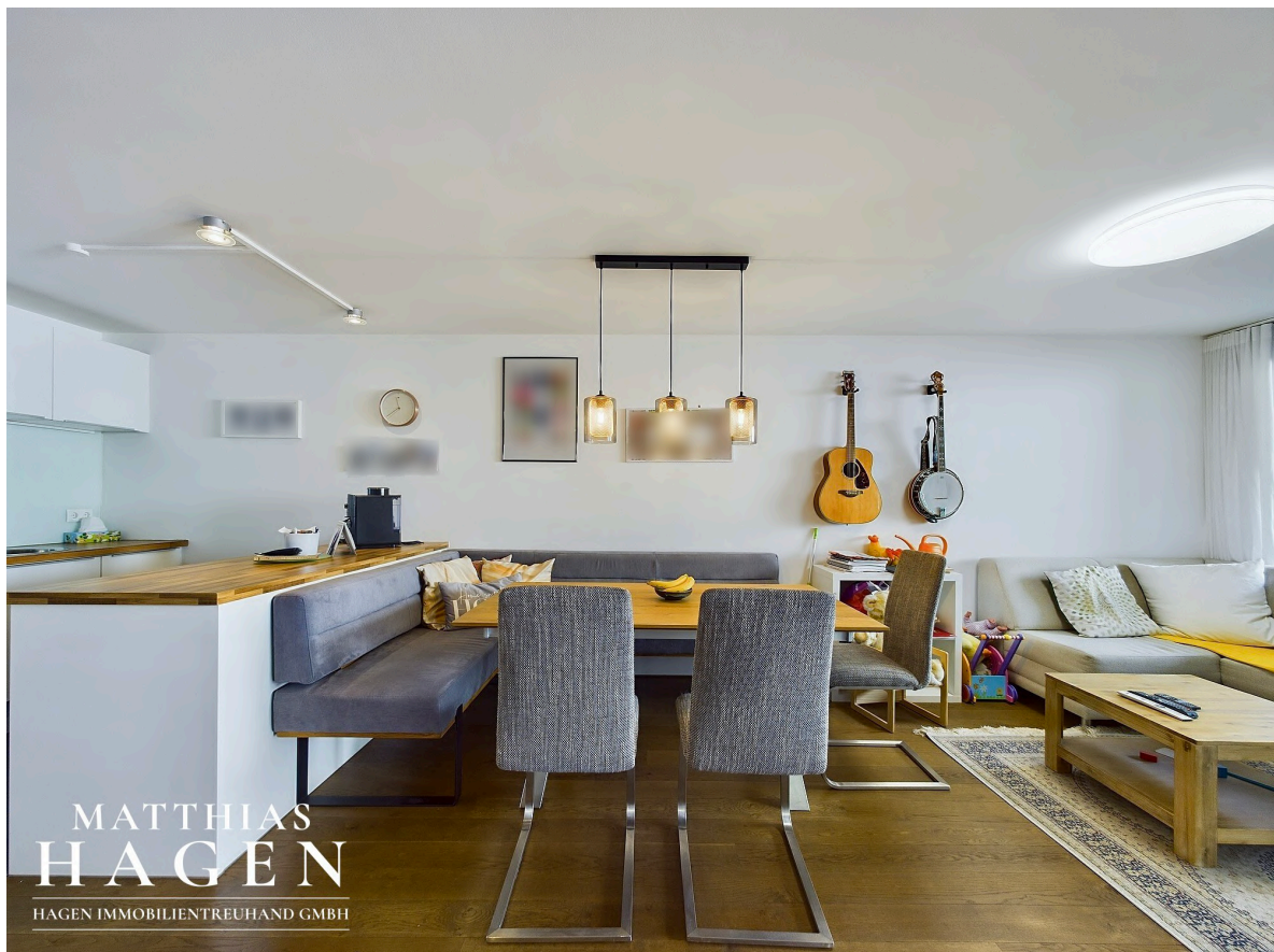
Wohnbereich mit Küche