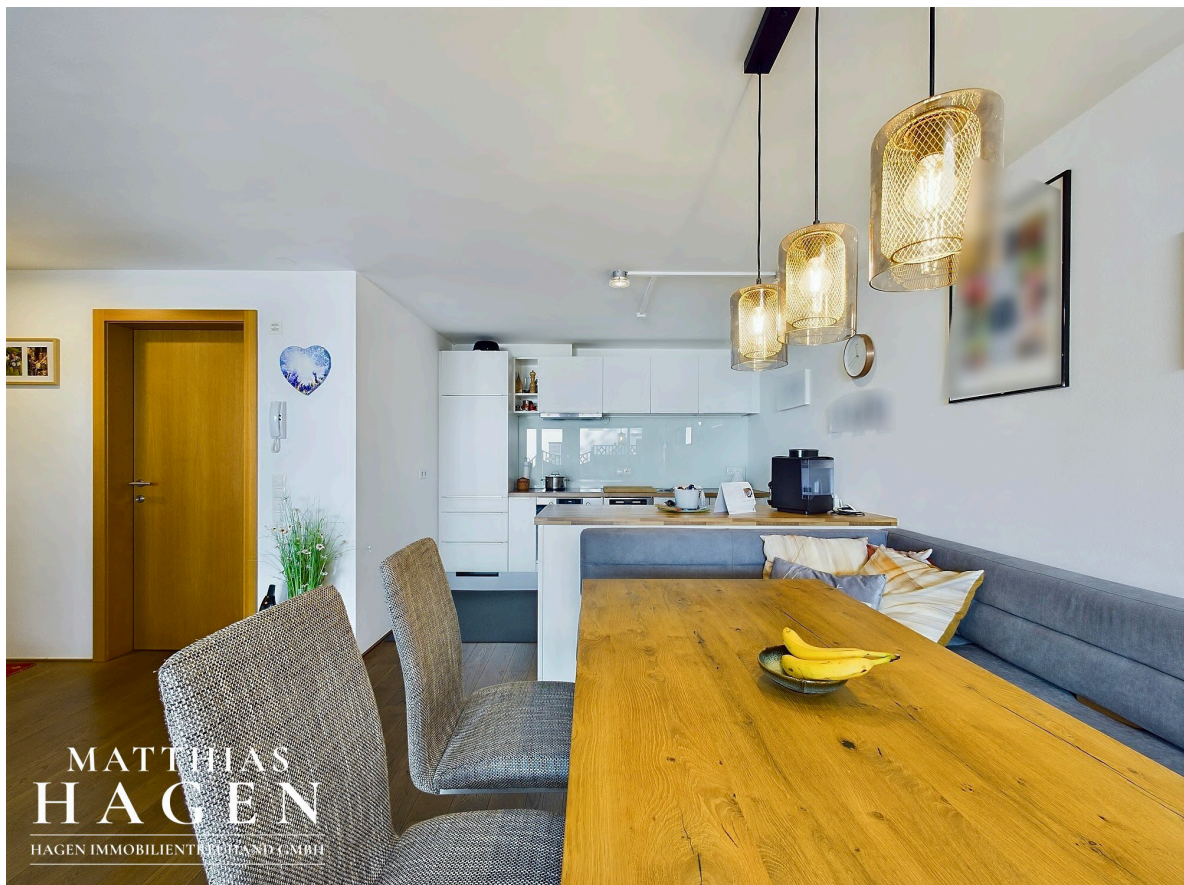
Wohnbereich mit Küche