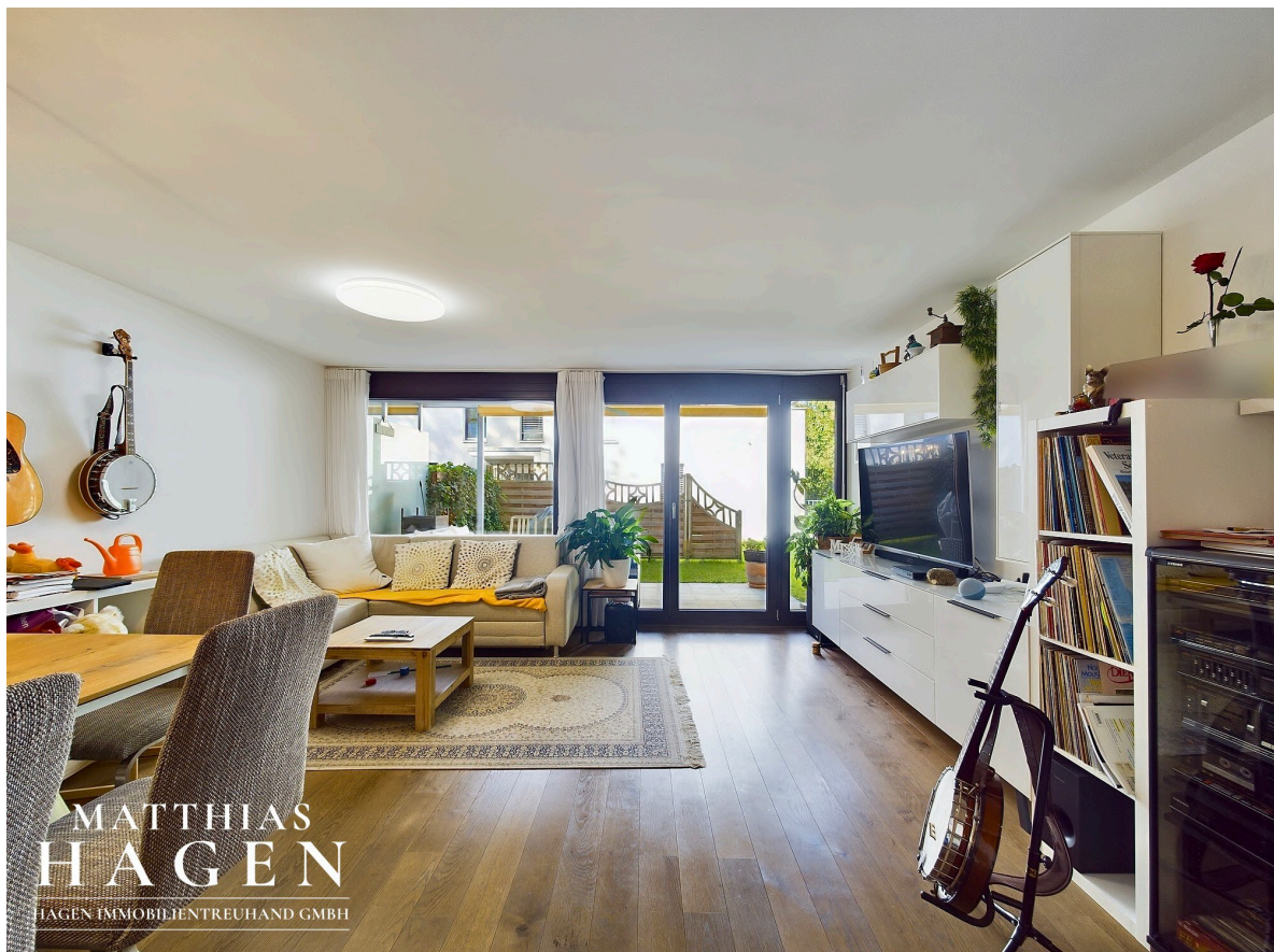
Garten mit Terrasse

MATTHIAS HAGEN HAGEN IMMOBILIENTREUHAND GMBH