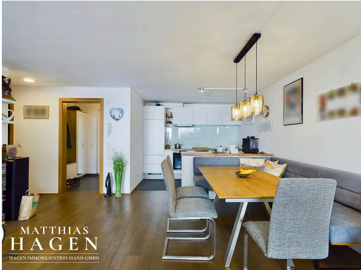
Wohnbereich mit Küche