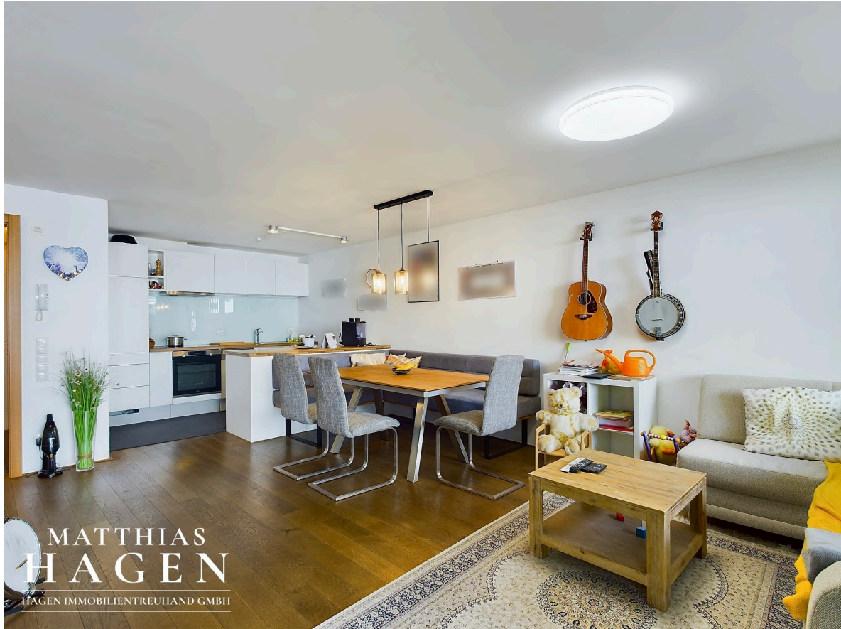
Wohnbereich mit Küche