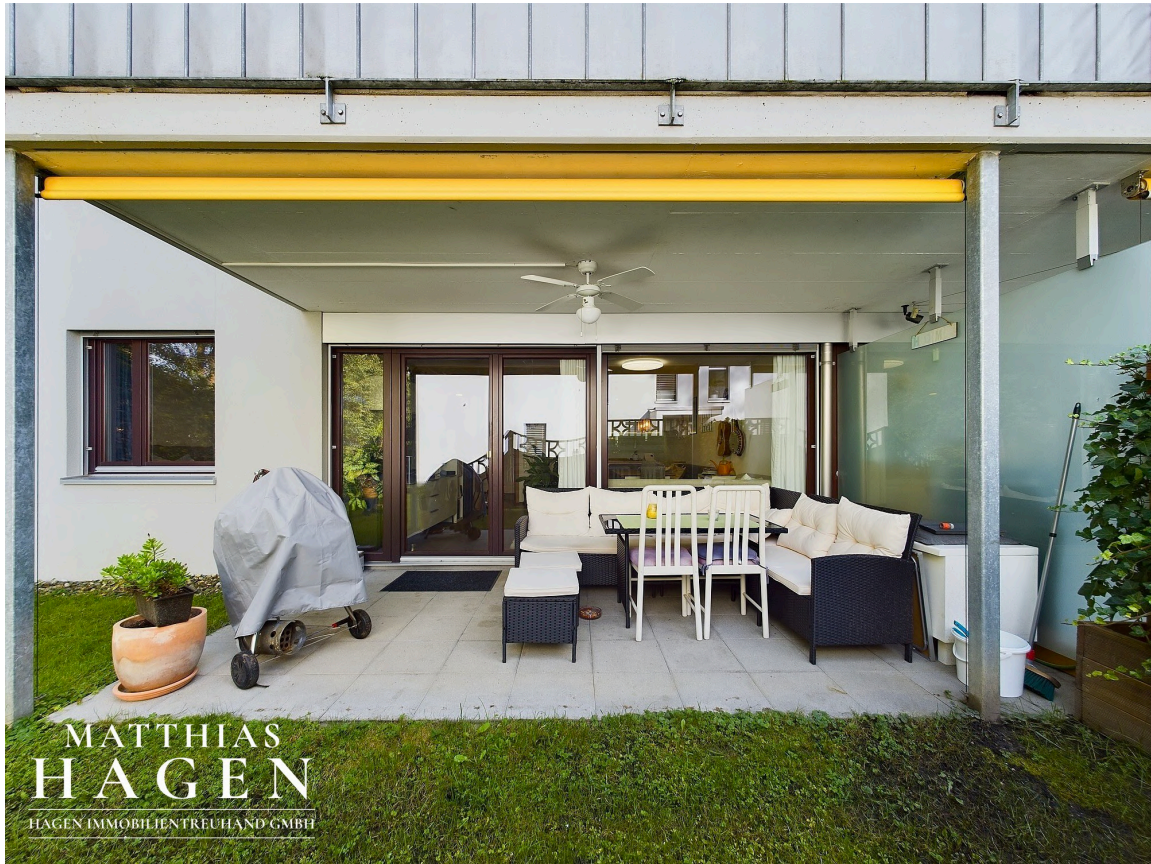
Garten mit Terrasse