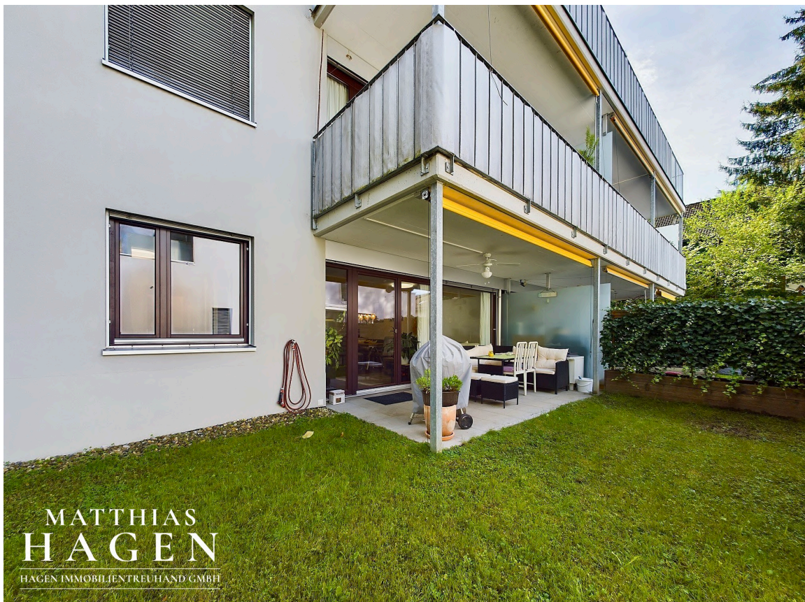
Garten mit Terrasse