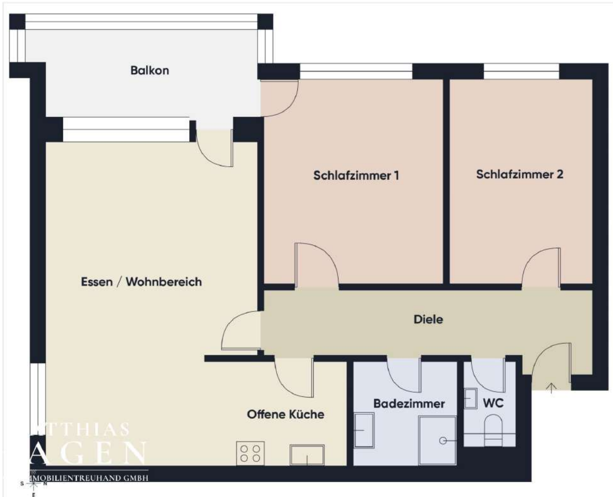
Grundriss ohne Maßstab