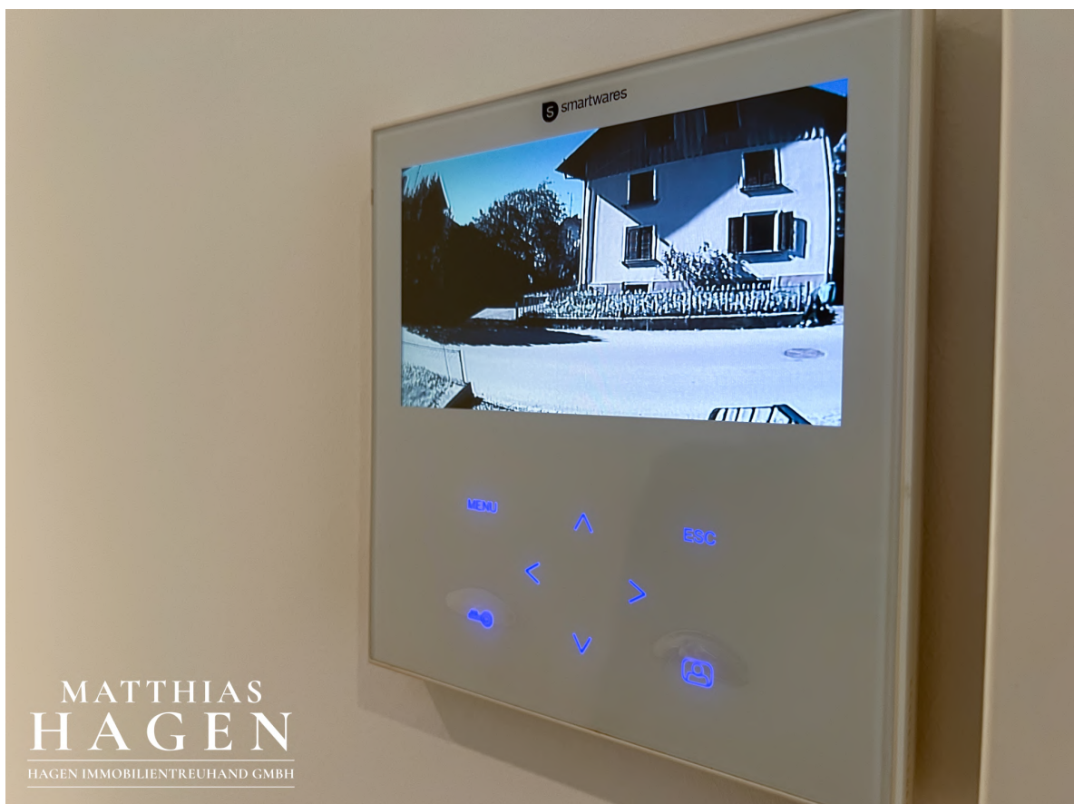
Sprechanlage mit Kamera