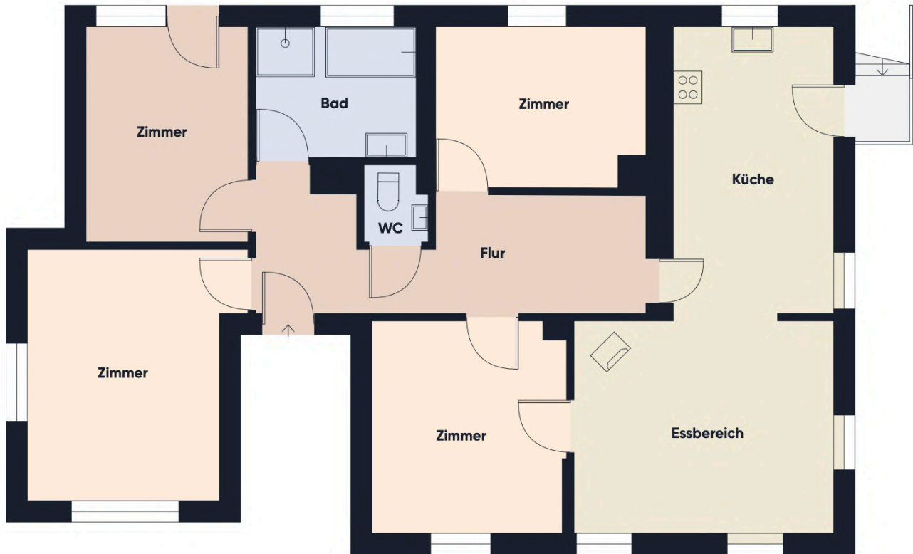
Grundriss ohne Maßstab