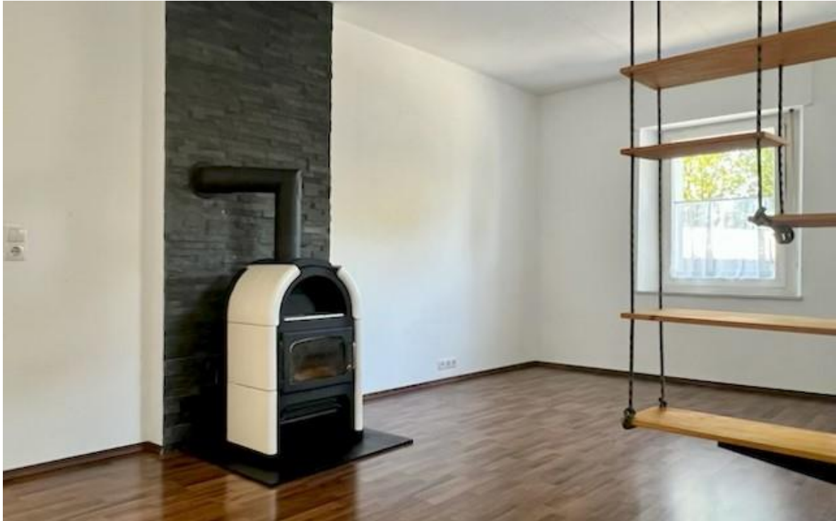
Beispiel einer Wohnung