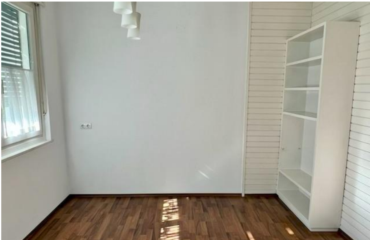
Beispiel einer Wohnung