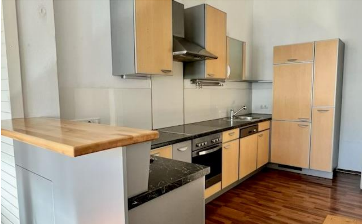
Beispiel einer Wohnung