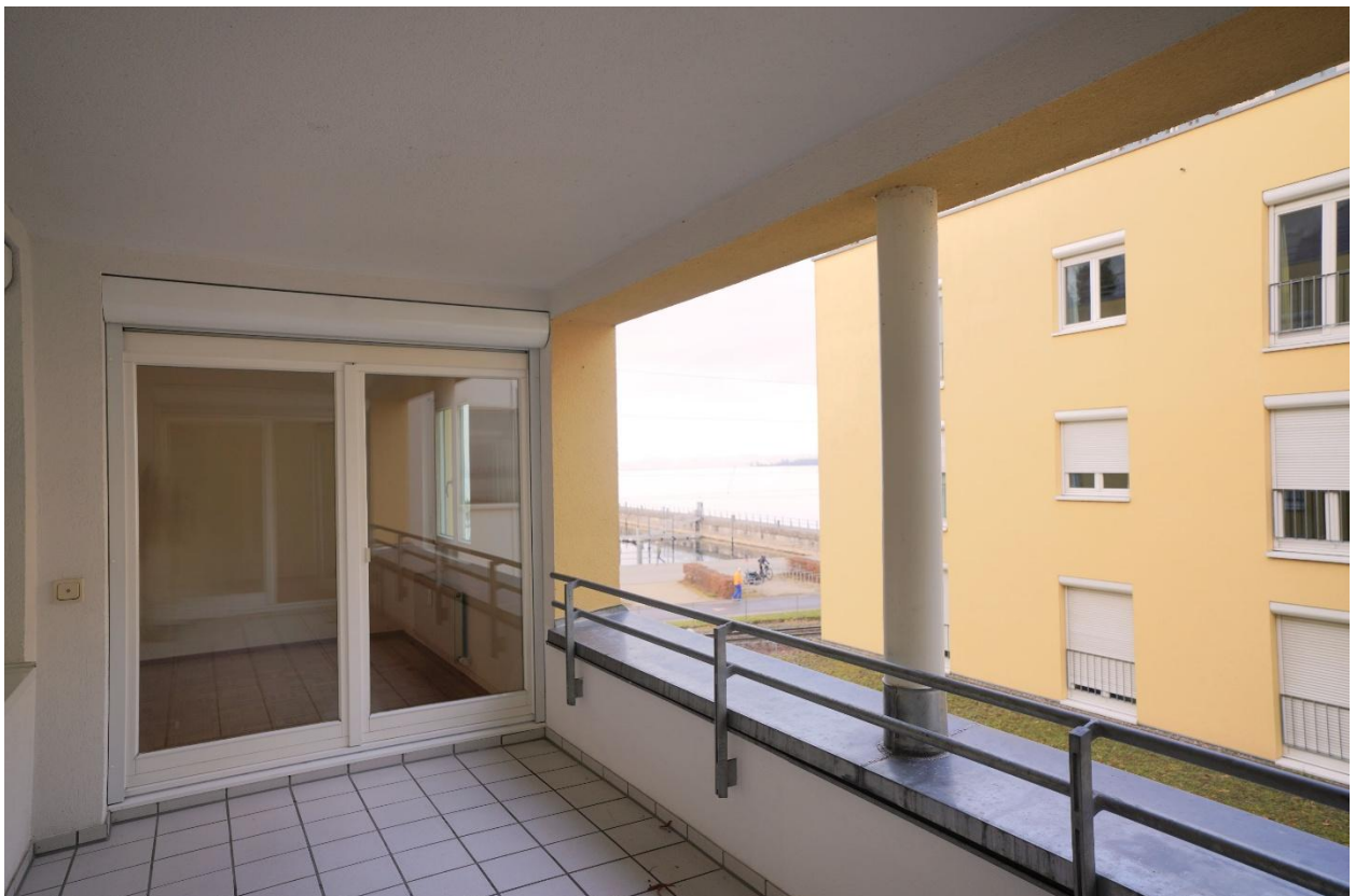
Balkon mit seitlichem Seeblick