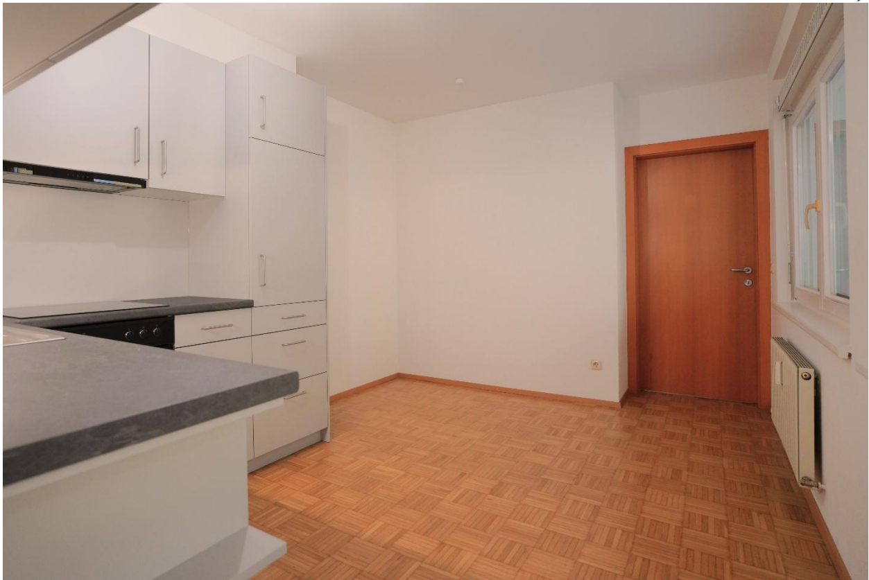
Essbereich in der offenen Küche