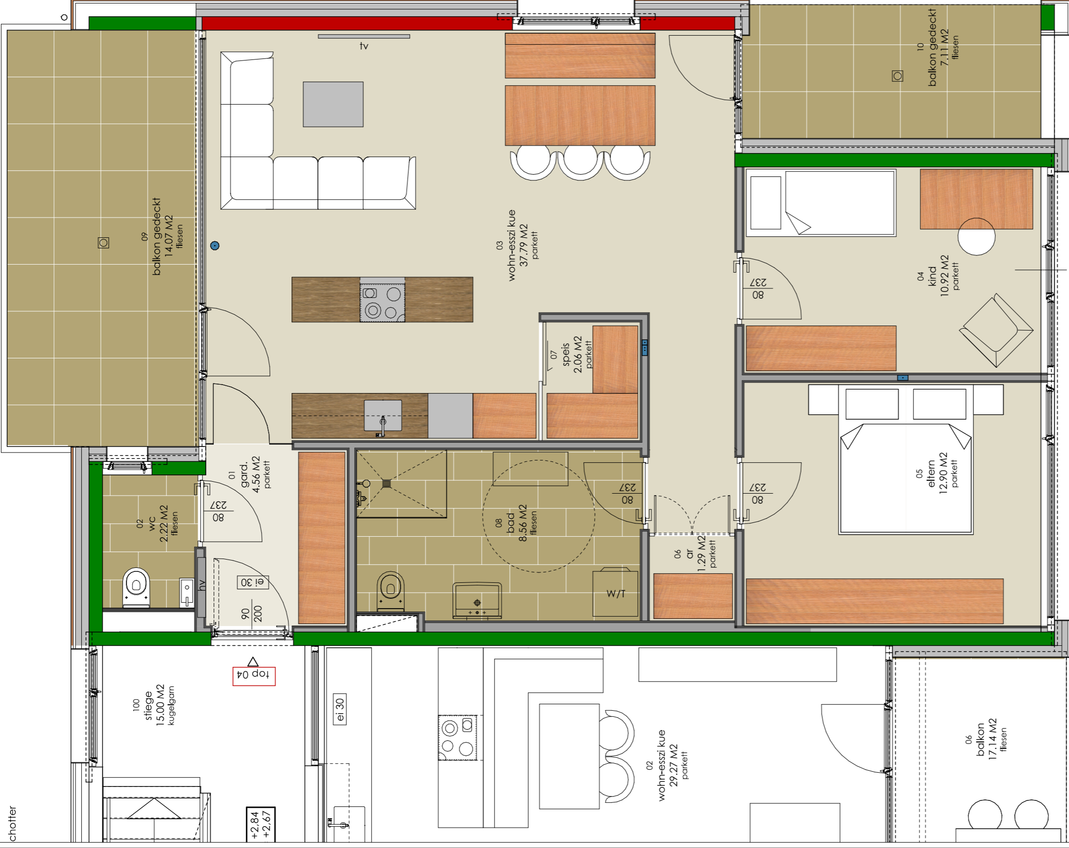
TOP 04 3-ZI WOHG.80,16 M 2