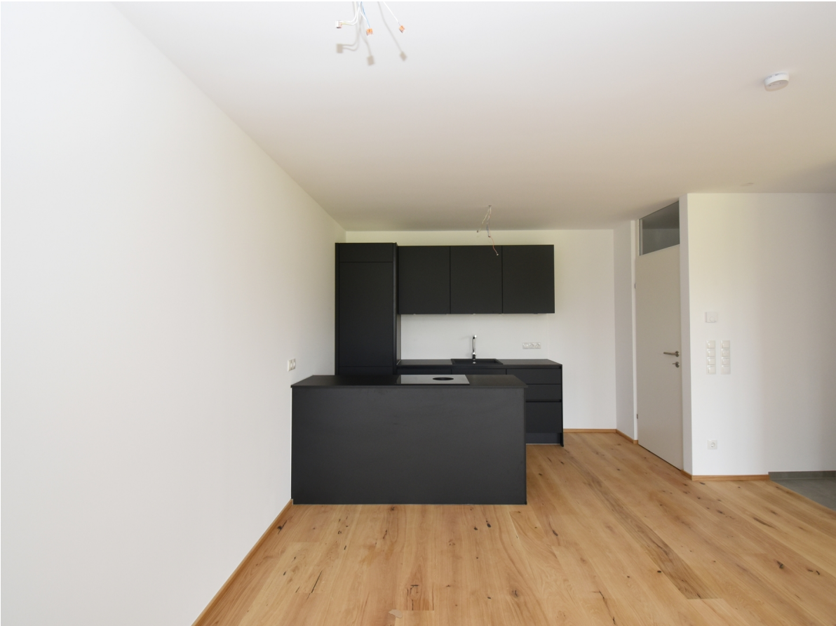
Küche / Esszimmer