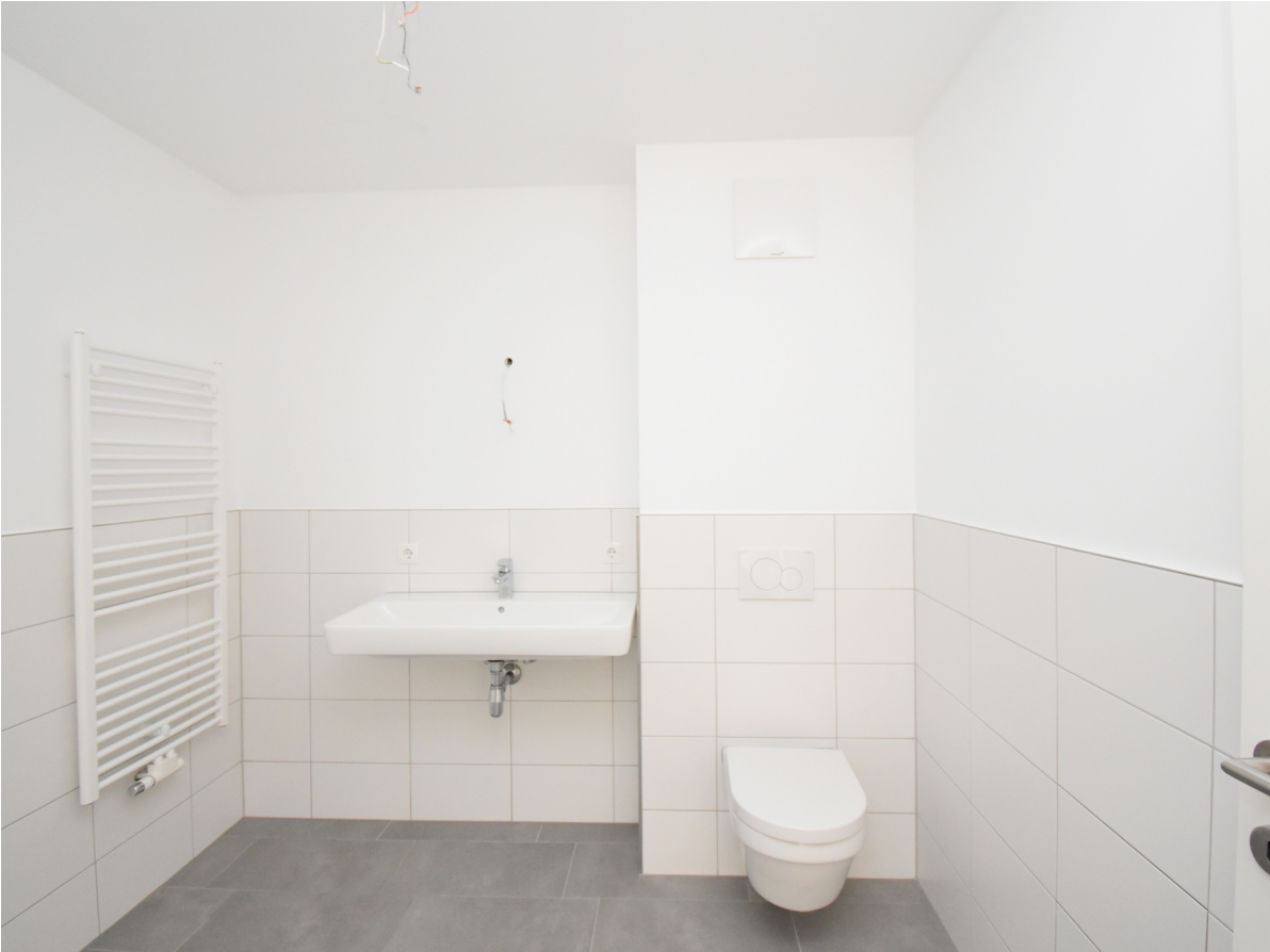
Bad / WC