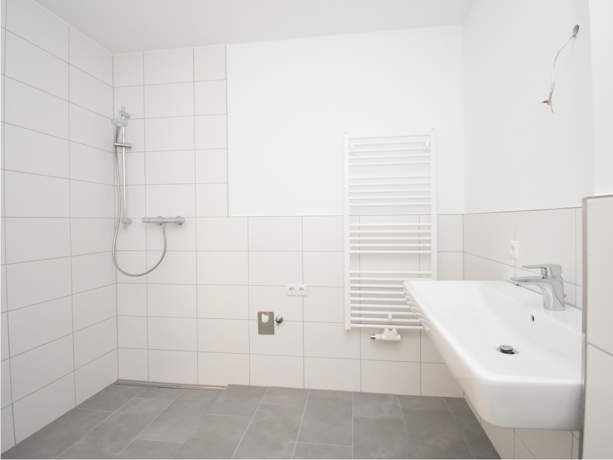
Bad / WC