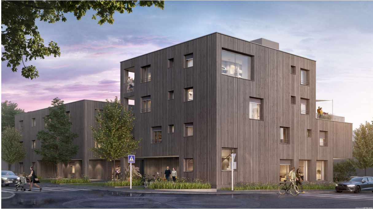
Haus B links, Haus A rechts, Ecke Hadeldorfstraße/Landammangasse