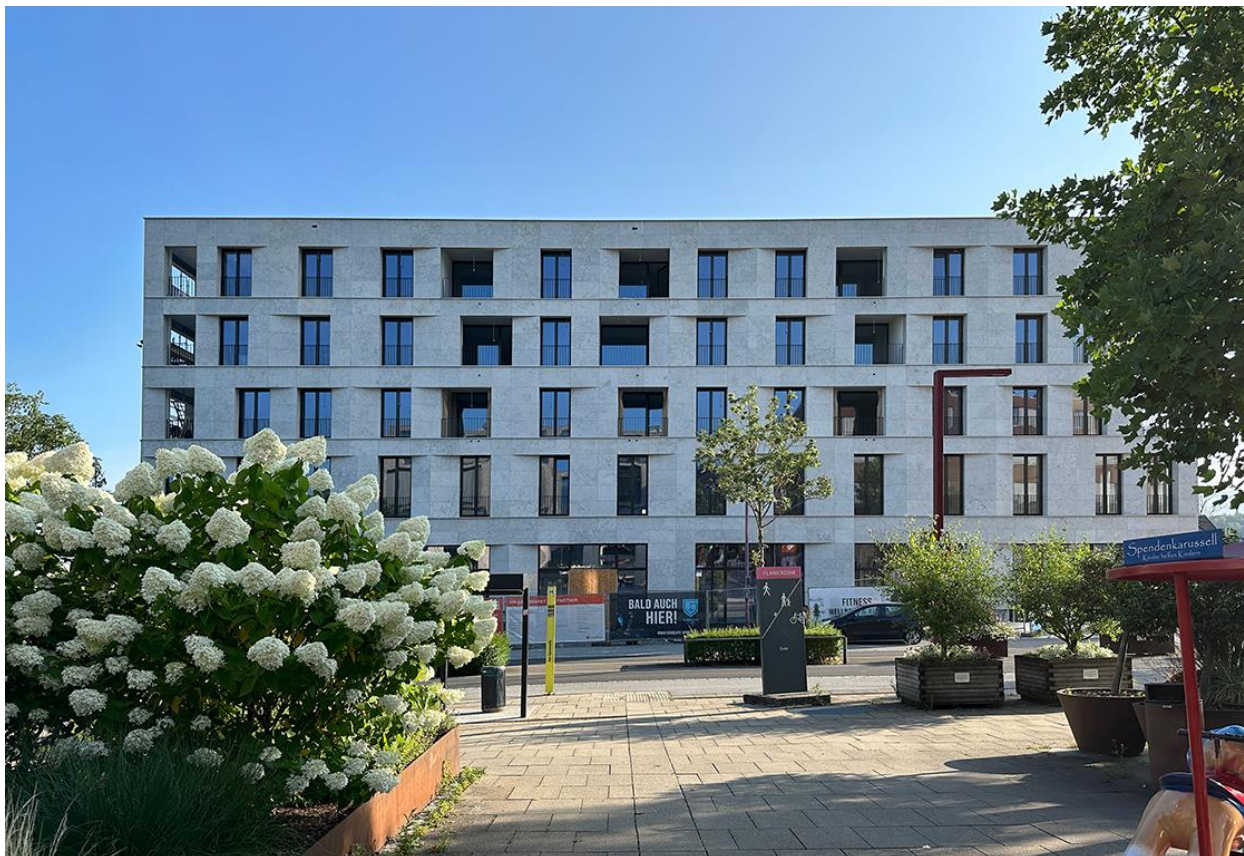
Am Garnmarkt 17, südseitig (von der Flanierzone) – Baustelle in Fertigstellung