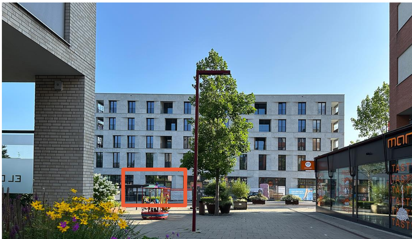
Ansicht Gebäude / Mietfläche EG