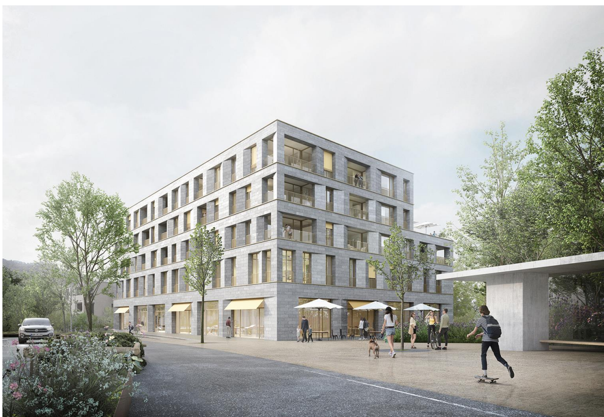
Visualisierung Gebäude Am Garnmarkt 17, ostseitig (neue Bushaltestelle)