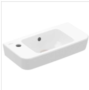
Handwaschbecken Villeroy & Boch SAPHIR VERITY DESIGN 2.0 500x250mm, m.HL, m.ÜL, weiss