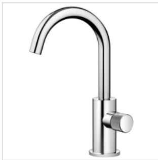
Standventil Dornbracht META Ausladung 123 mm, chrom