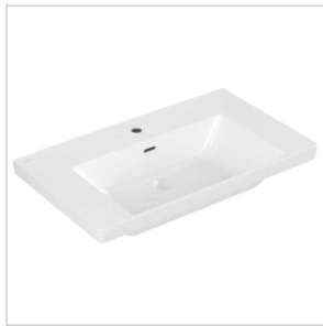
Möbel-Waschtisch Villeroy & Boch SAPHIR SUBWAY S-LINE 800x470mm, 1 HL, m.ÜL, weiss Alpin