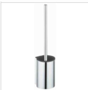
Bürstengarnitur PLAN ohne Deckel, chrom