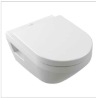
Wand-WC Tiefspüler Villeroy & Boch SAPHIR VERITY 370x530 mm, spülrandl., weiss