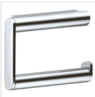
Rollenhalter Keuco PLAN ohne Deckel, chrom