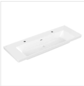
Möbel-Waschtisch Villeroy & Boch SAPHIR SUBWAY S-LINE 1300x475mm, 2 HL, m.ÜL, weiss Alpin