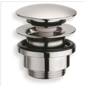
Ablaufventil Optima 5/4", chrom