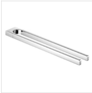
Handtuchhalter 2-arm Keuco MOLL chrom, Ausladung 450 mm