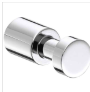
Haken Optima L 1.2 chrom, Ausladung 35 mm