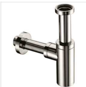
Design WT-Sifon DIAMANT FLORA 5/4"ÜM, Abgang D 32 mm, chrom