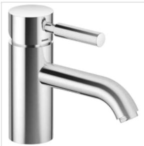
Waschtischmischer Dornbracht SAPHIR EDITION PRO o.Ablgarn., Ausld. 126 mm, chrom