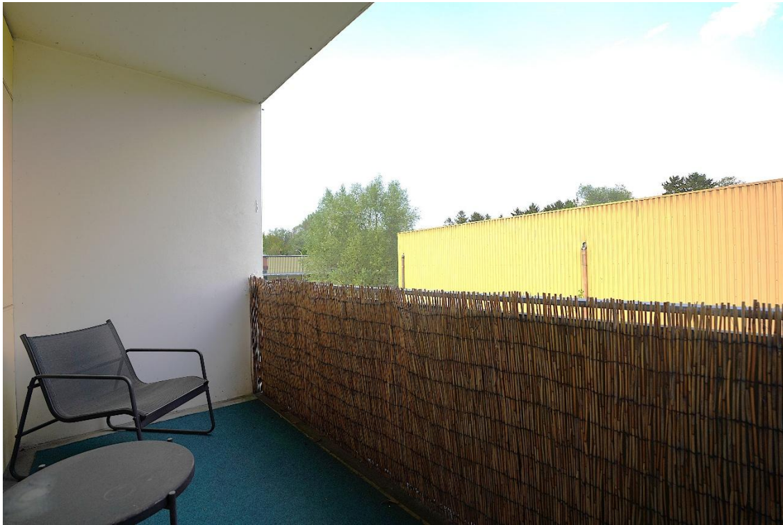
Balkon vor dem Wohnzimmer