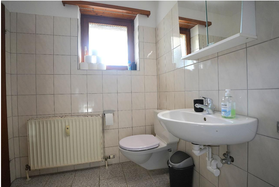
Bad mit Dusche und WC