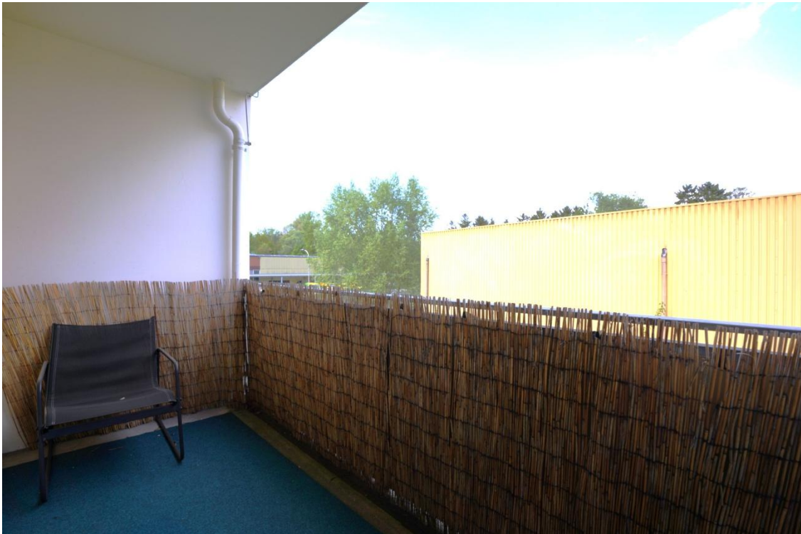
Balkon vor dem Schlafzimmer