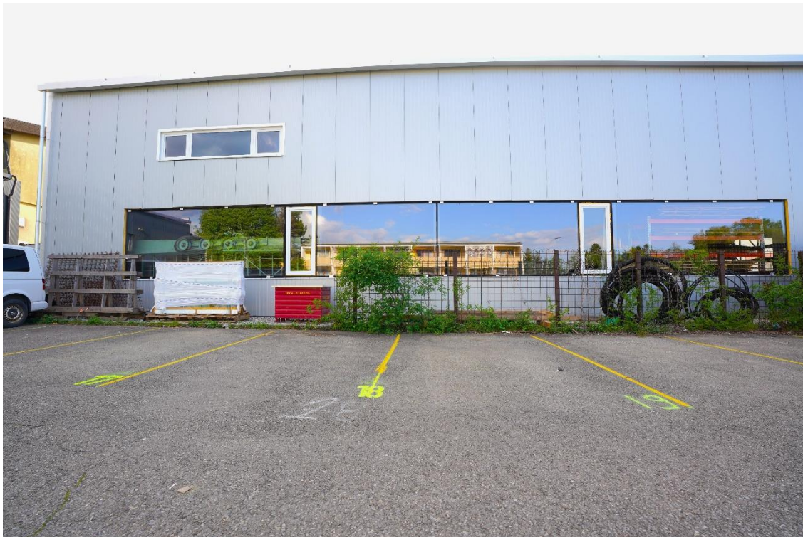
2 zugeordnete PKW-Stellplätze