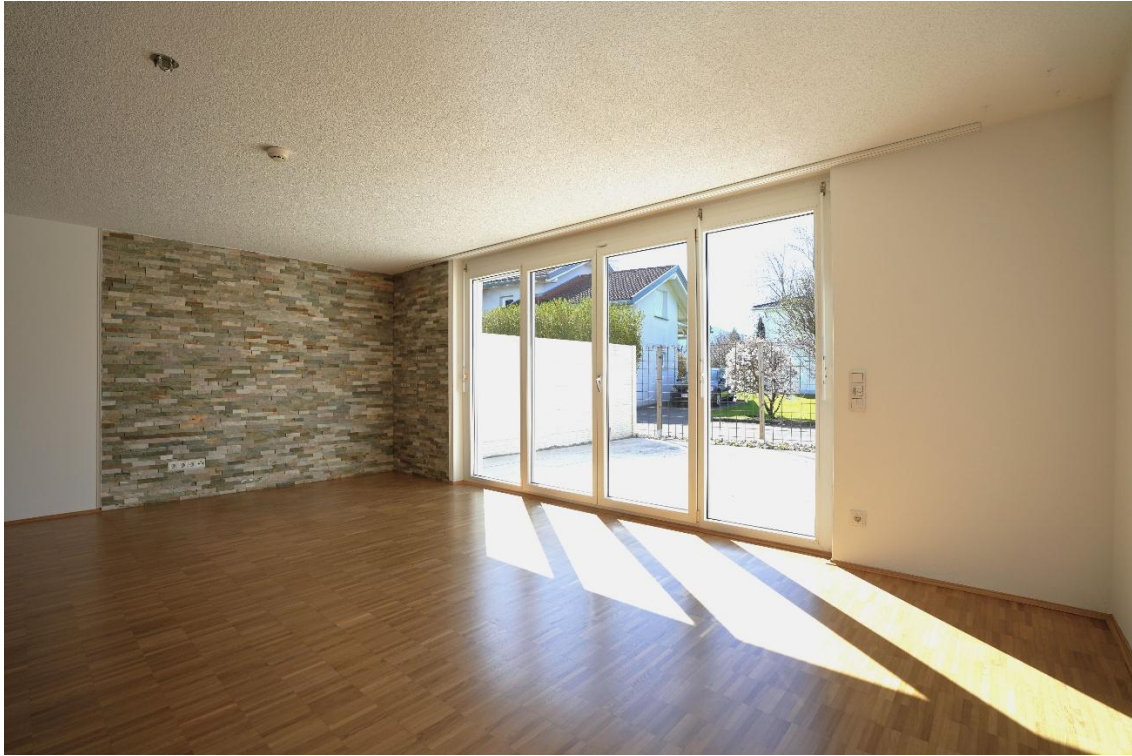
Wohnzimmer / Esszimmer mit Zugang zur Terrasse