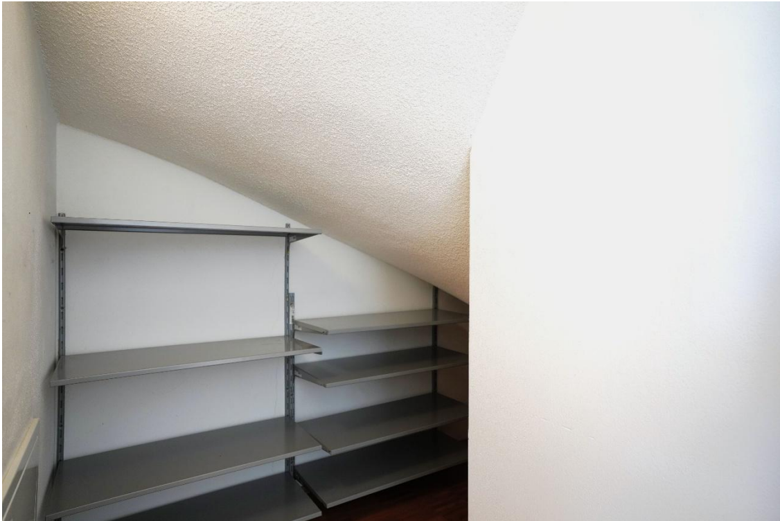
Abstellraum unter der Stiege