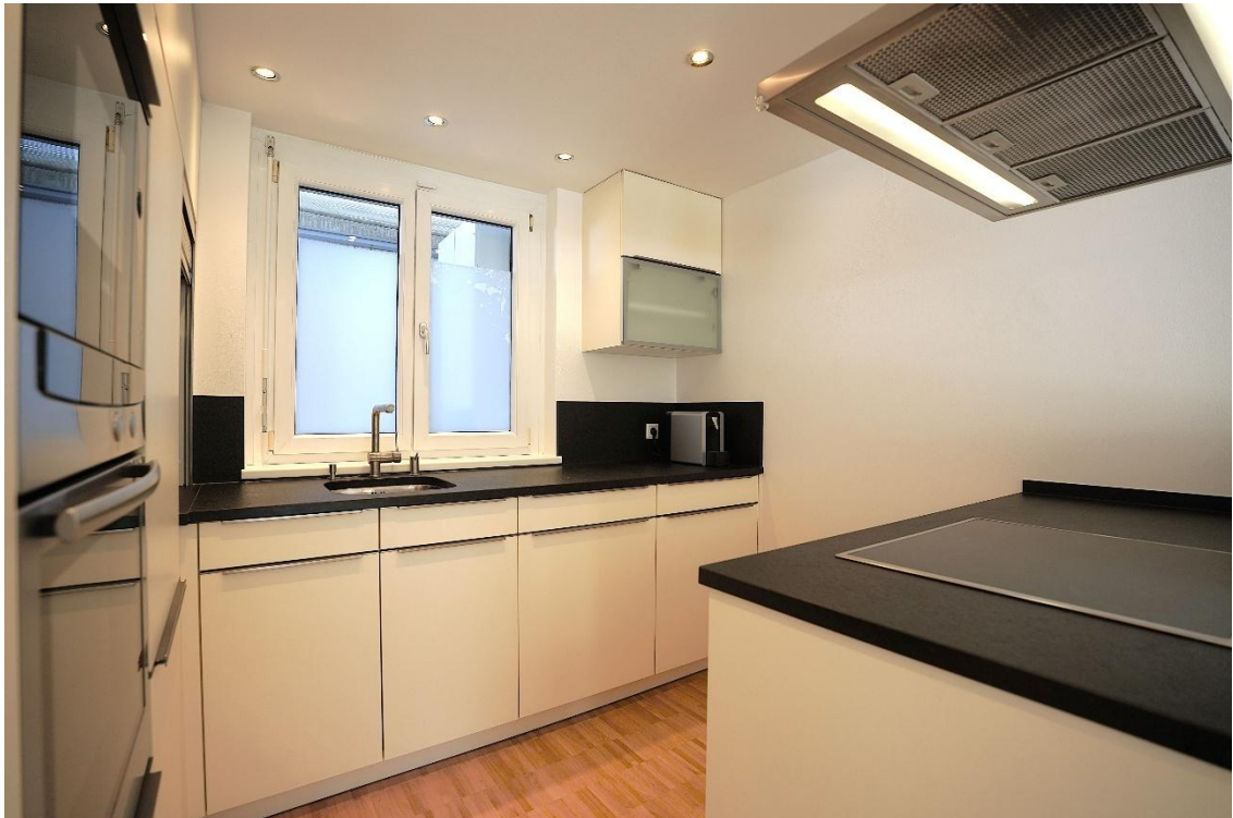
Offene Küche mit Kücheninsel