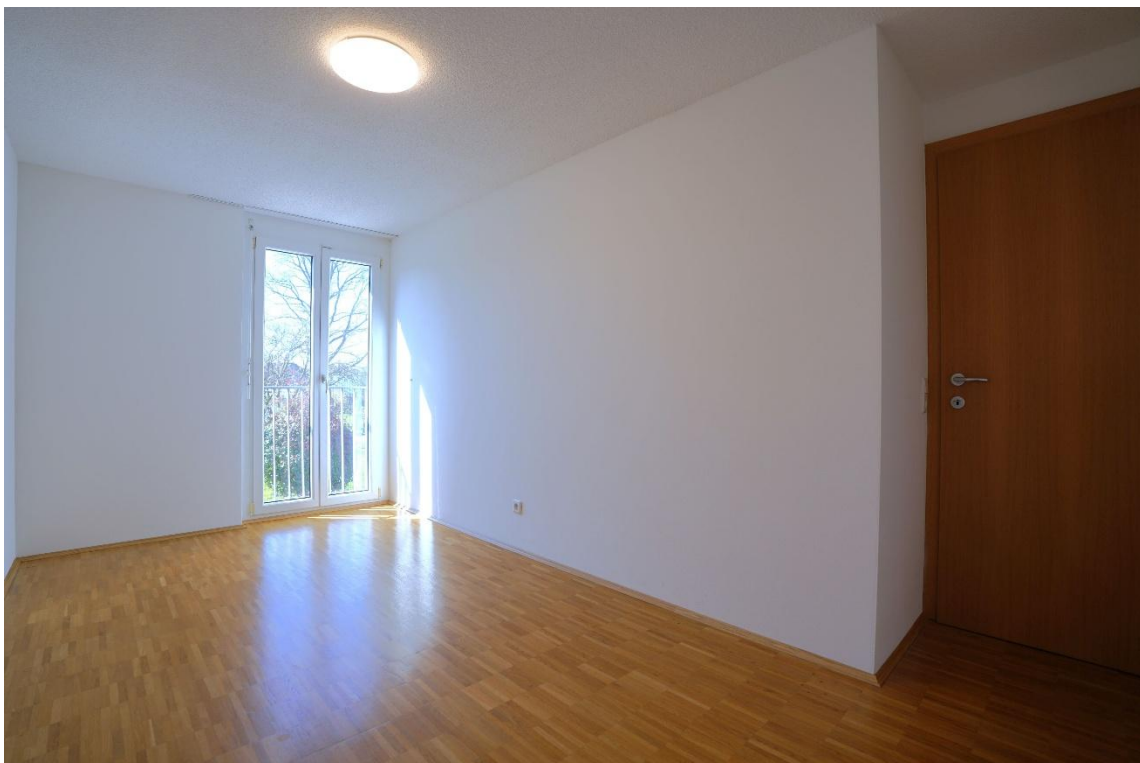
Kinderzimmer 2 / Büro 2