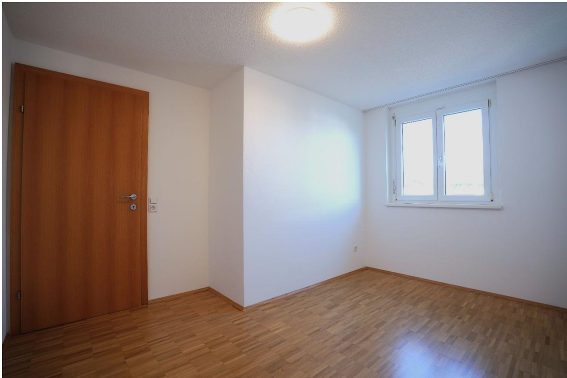
Kinderzimmer 1/ Büro 1