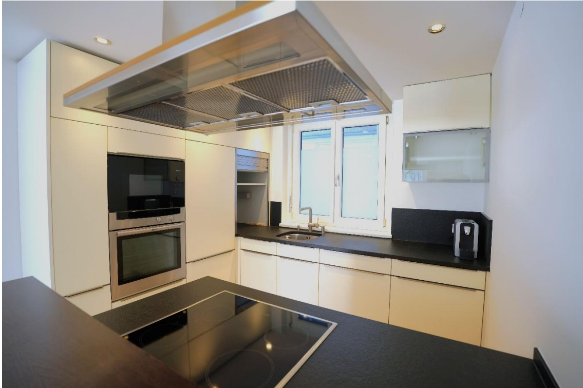
offene Küche mit Kochinsel