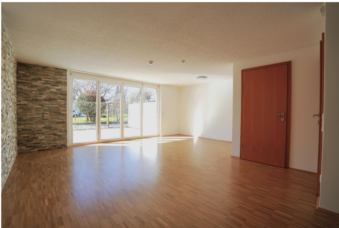
Wohnzimmer / Esszimmer mit Zugang zur Terrasse