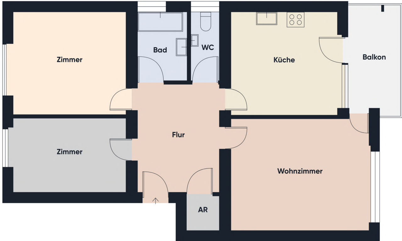
Grundrissplan ohne Maßstab