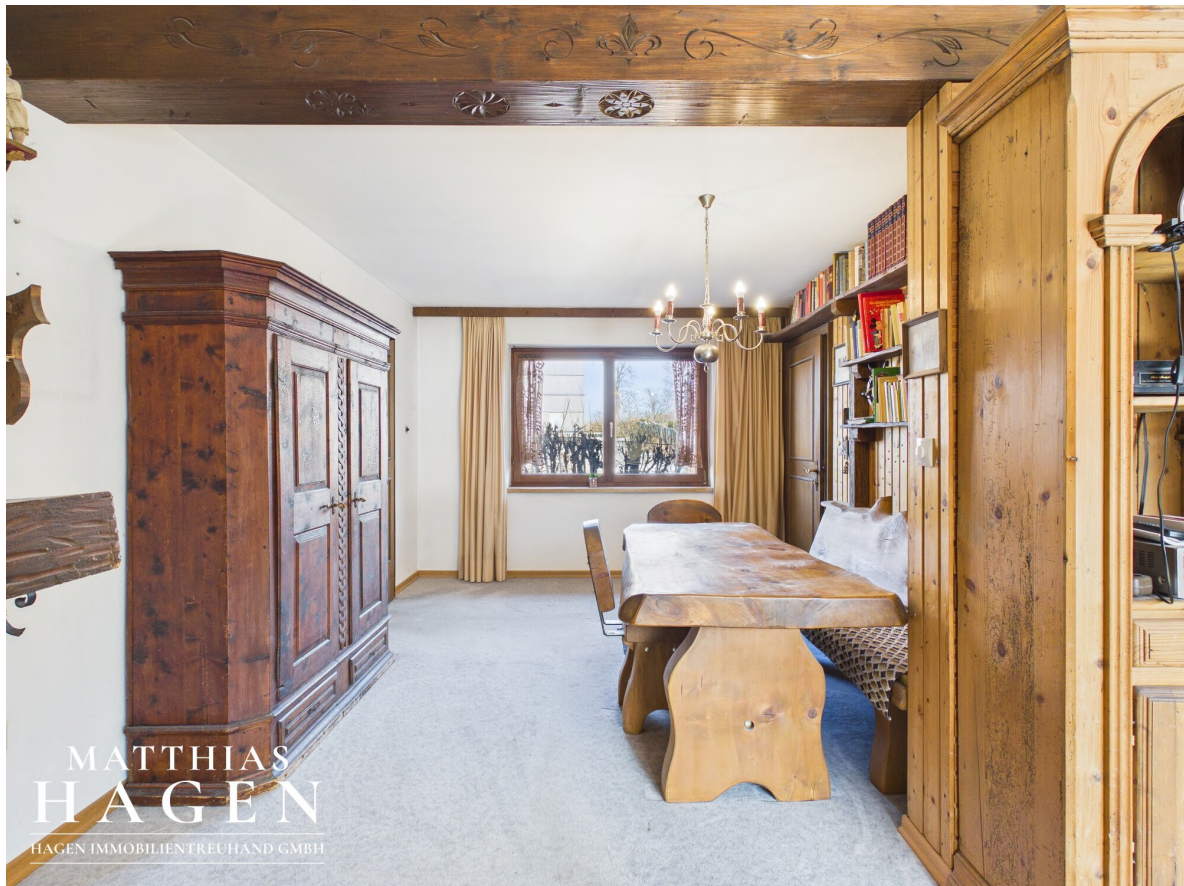
Wohn/Essbereich - OG