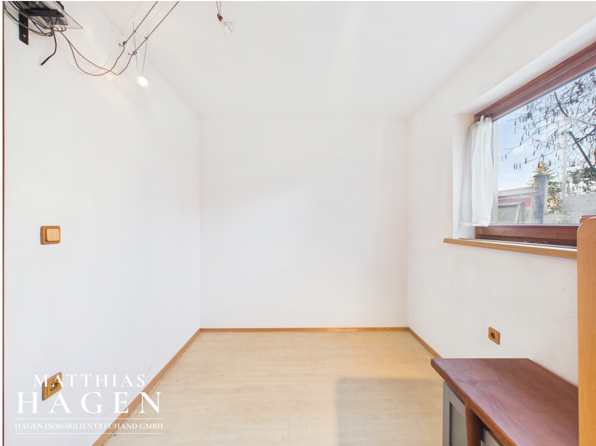
Zimmer 3 - EG