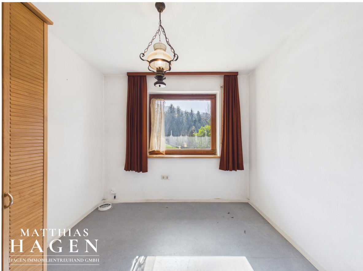
Zimmer 2 -EG