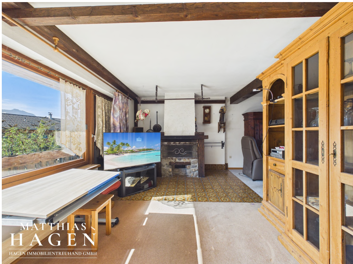
Wohnzimmer - OG