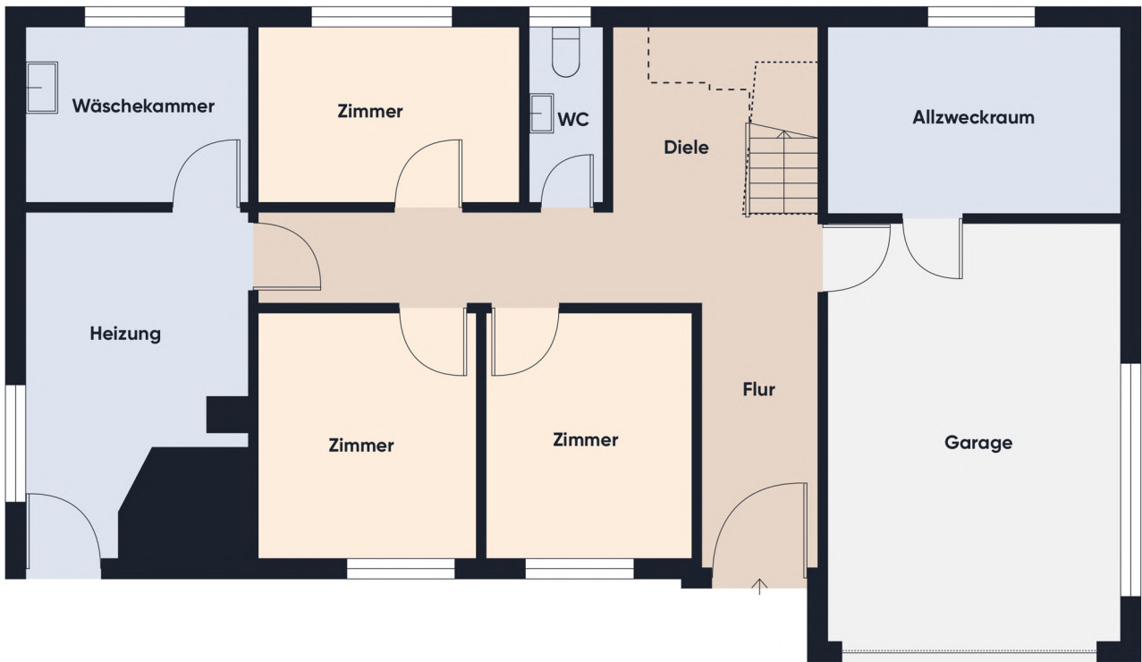
Grundrissplan ohne Maßstab EG