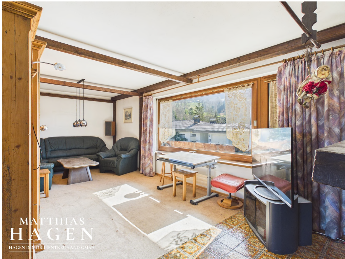
Wohnzimmer - OG