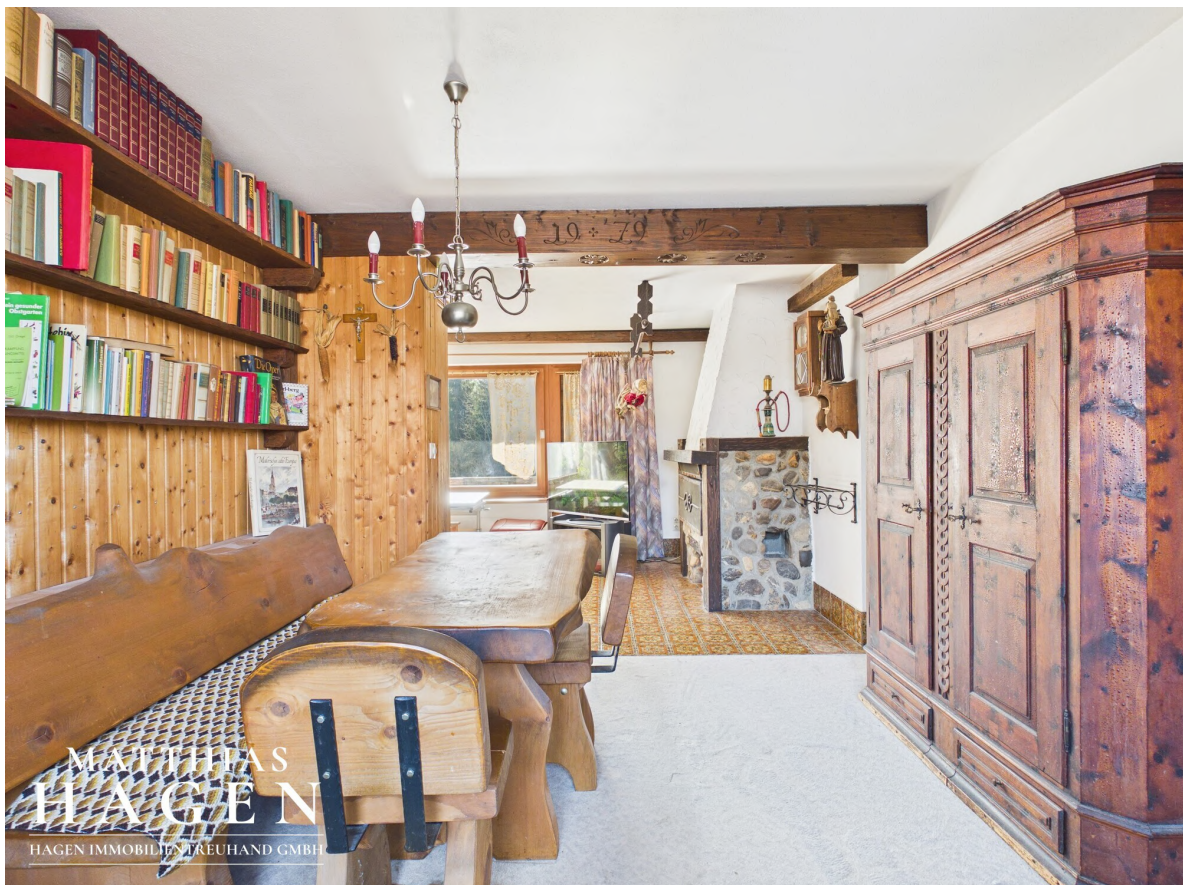
Wohn/Essbereich - OG