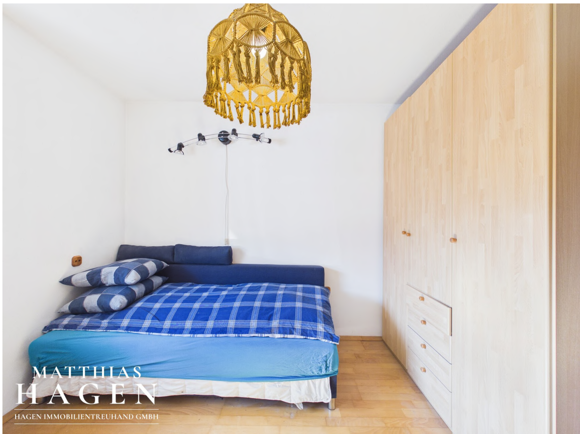
Zimmer 4 - EG