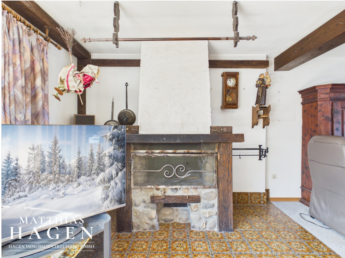
Wohnzimmer - OG