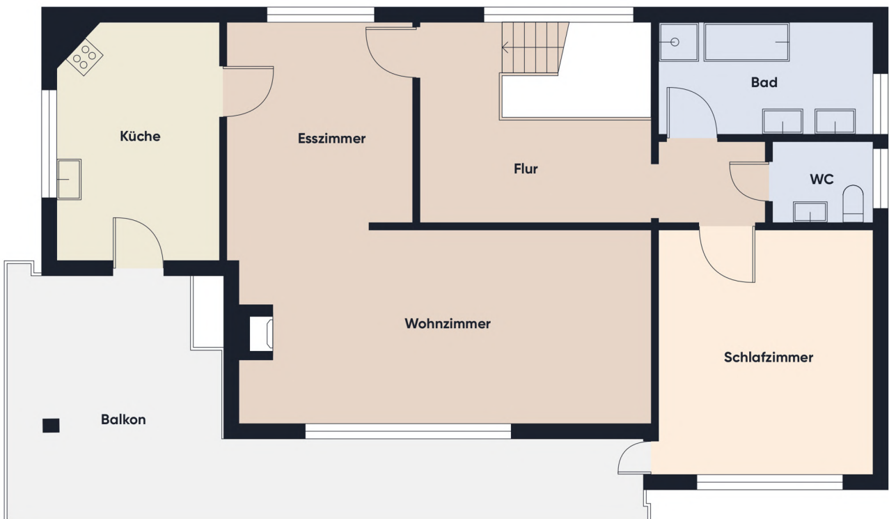
Grundrissplan ohne Maßstab OG