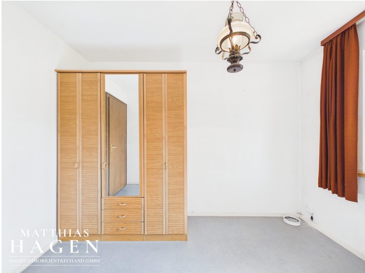
Zimmer 2 -EG