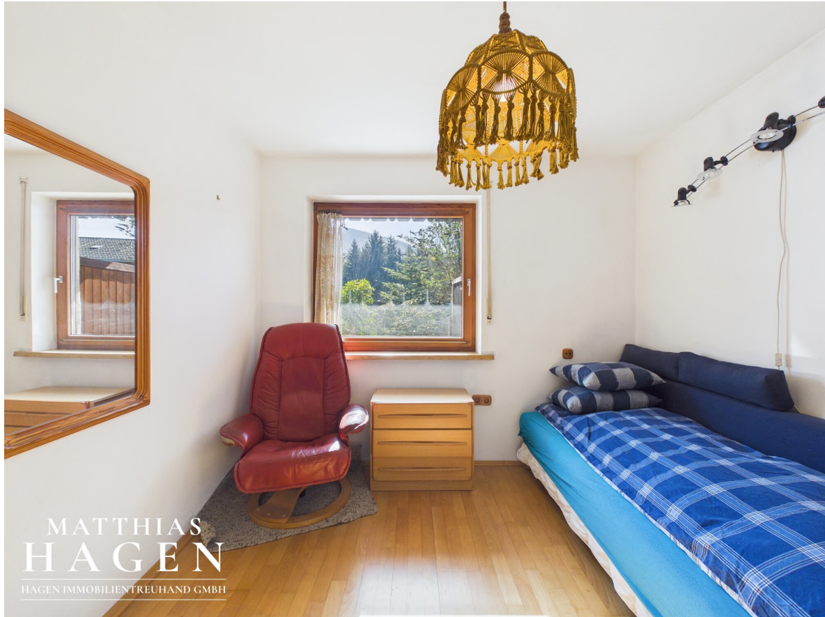
Zimmer 4 - EG