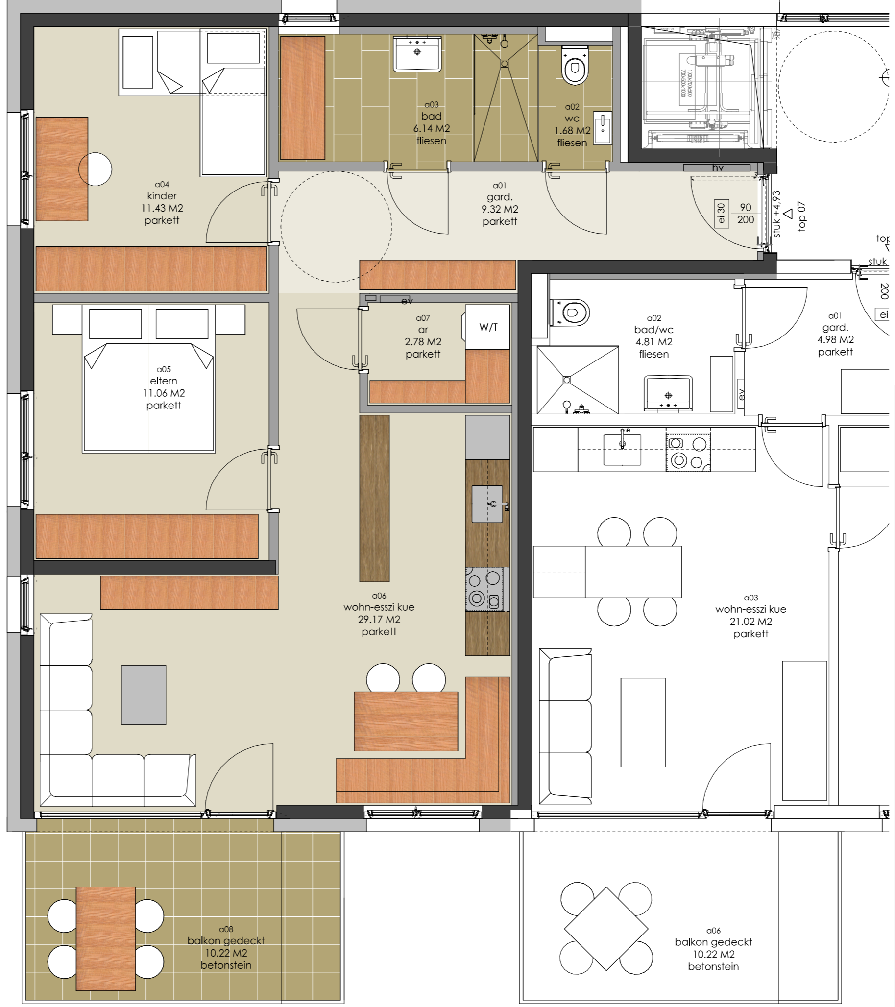
3-ZI WOHG. 71,58 M2