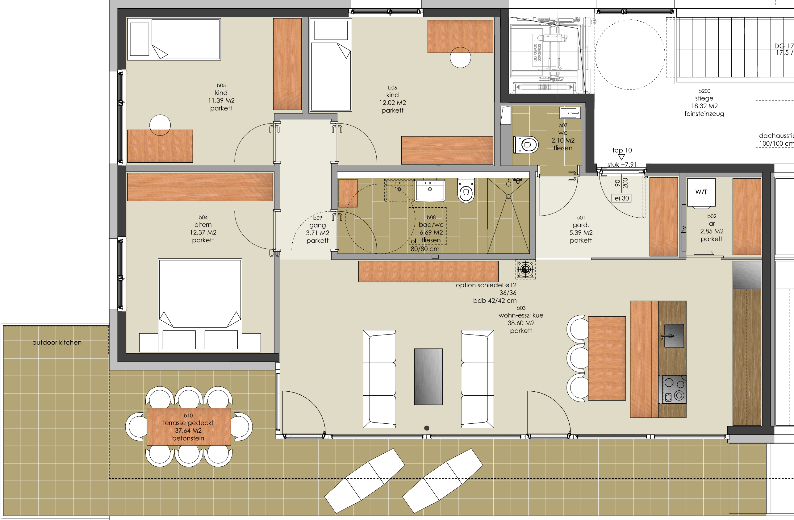
4-ZI PENTHOUSE 95,13 M2