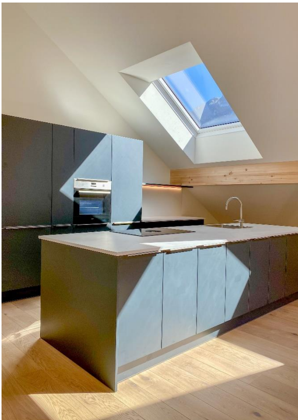
Blick zur Kanisfluh