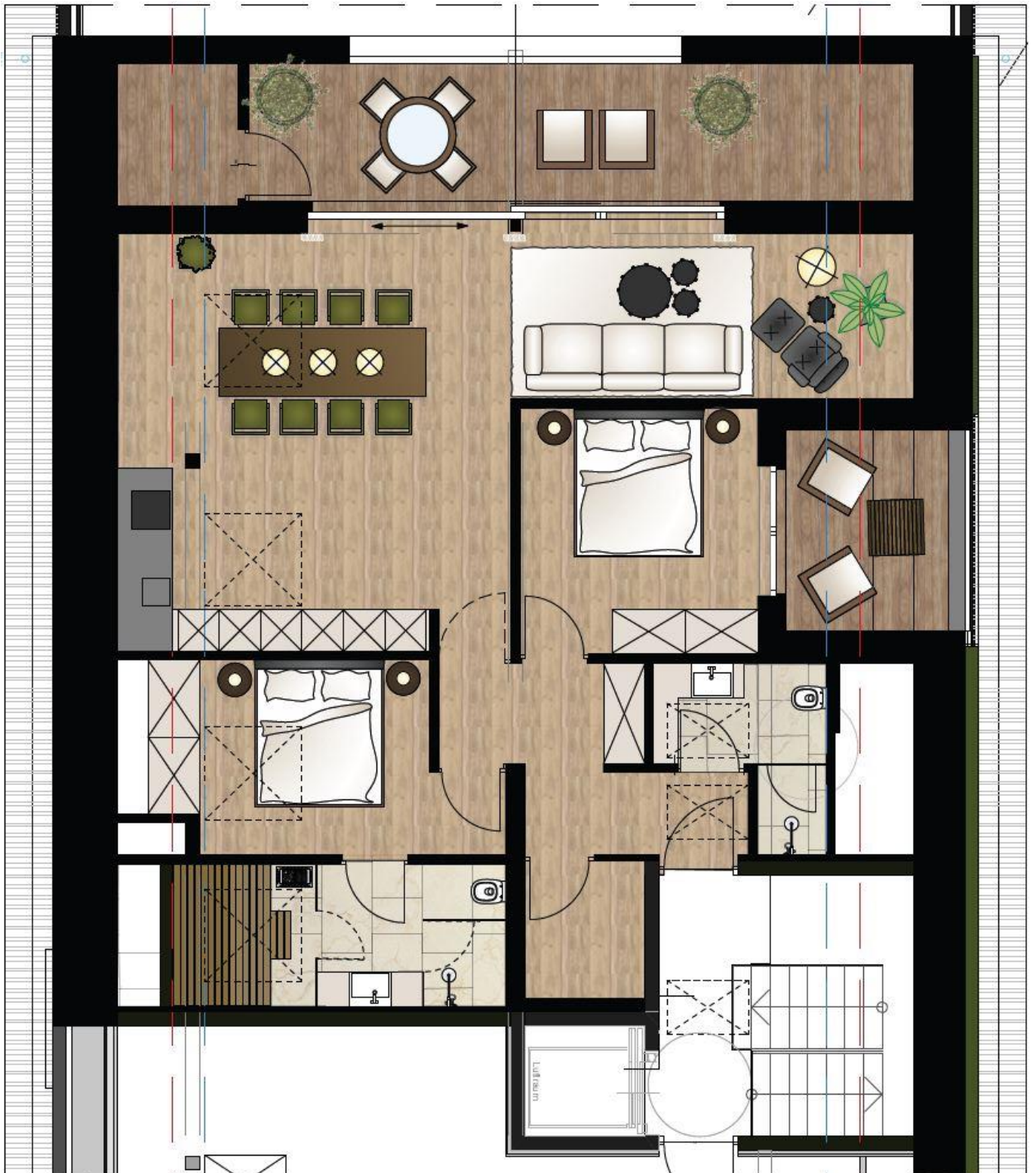
Grundriss Top 7, DG