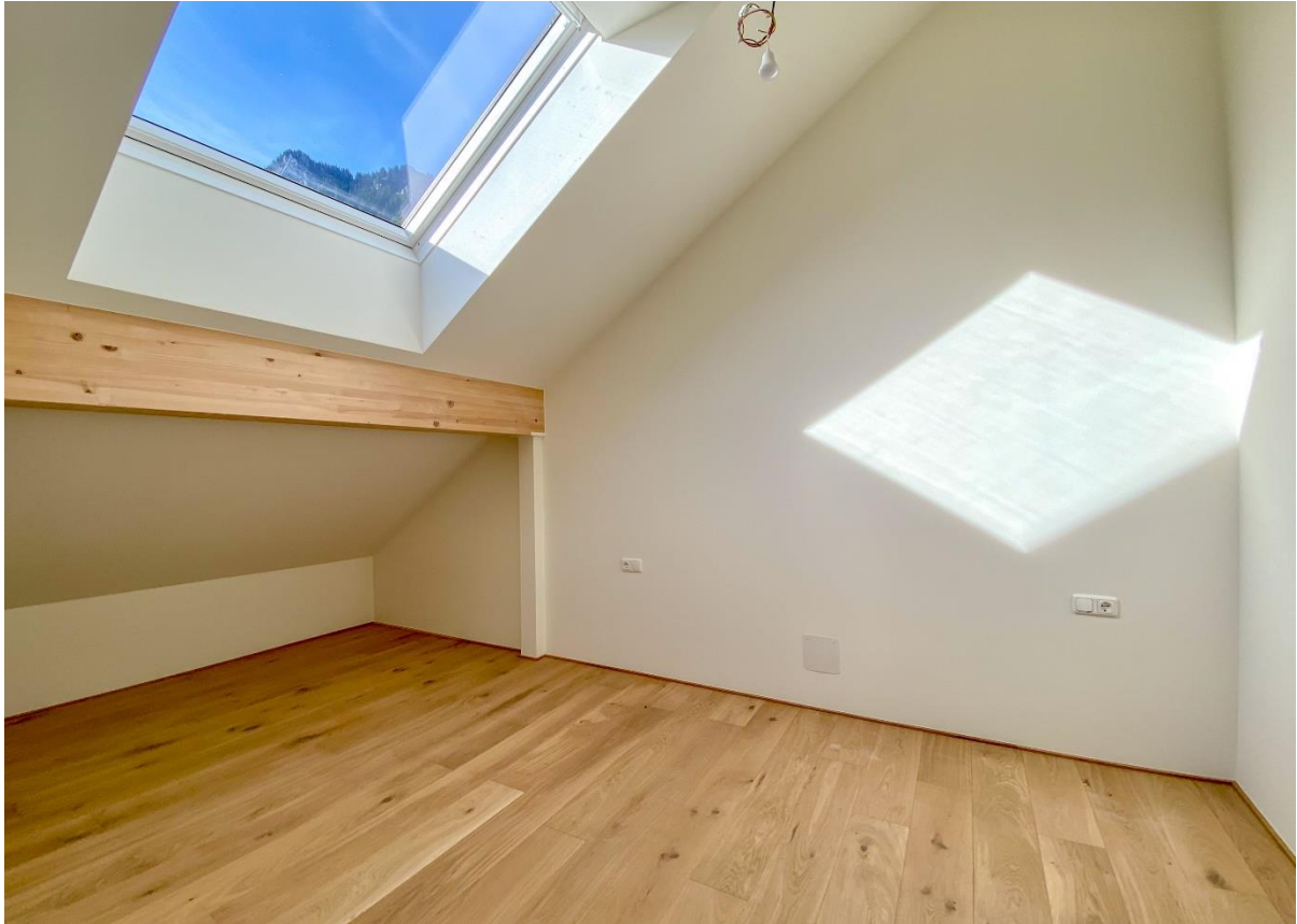
Schlafzimmer 2 .....