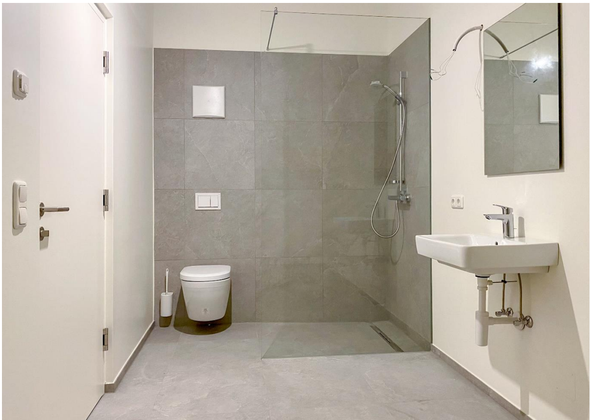
..... mit separatem, vollwertigem Badezimmer