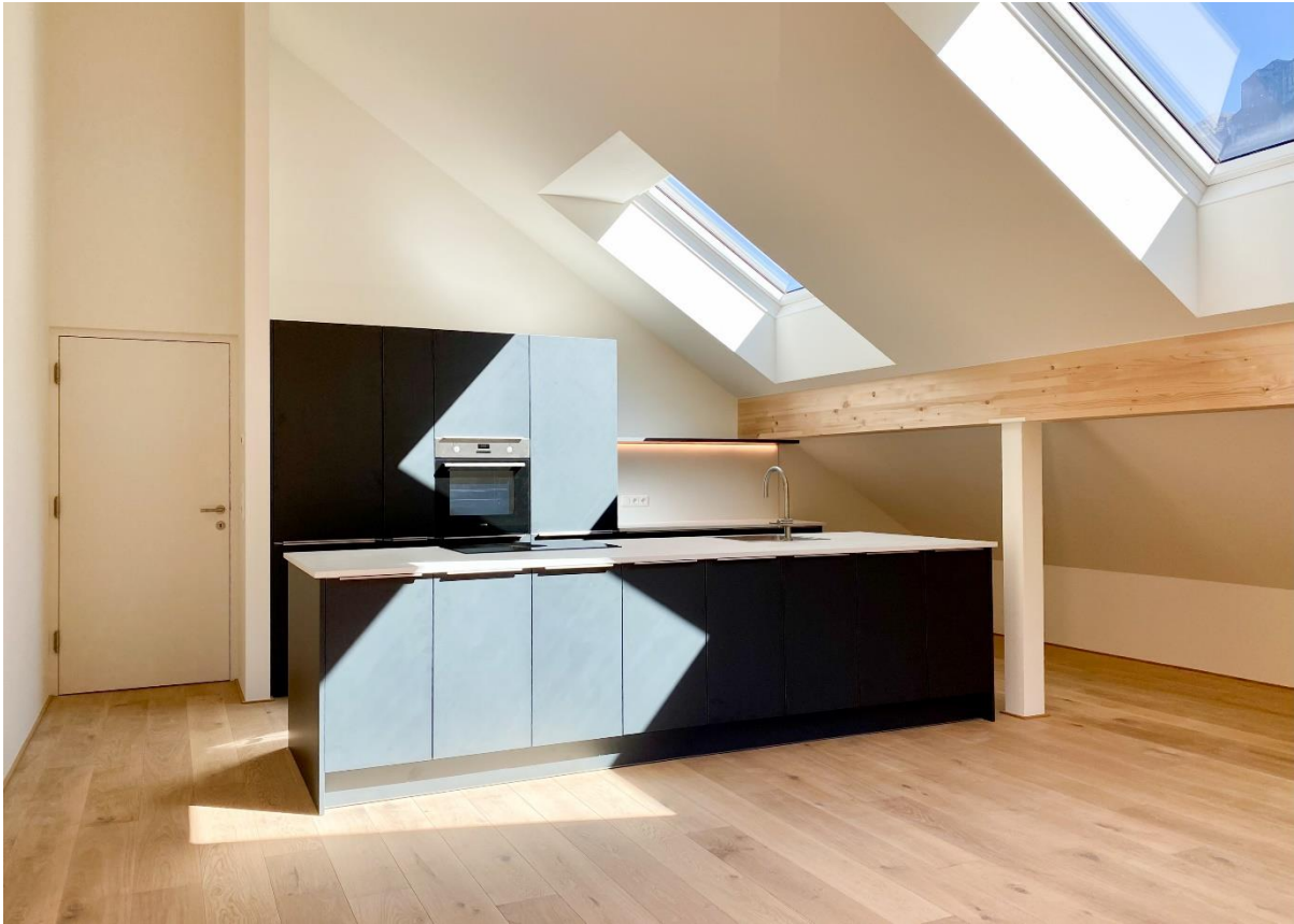
Kochen / Essen