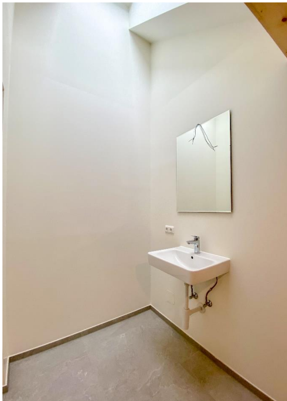
Waschbecken mit Tageslicht