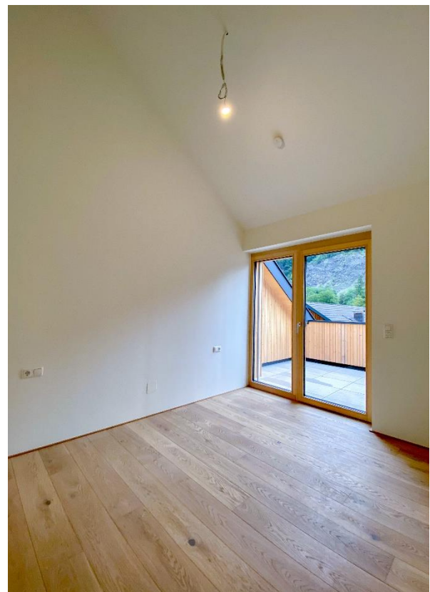
und Dachschräge bis zum First