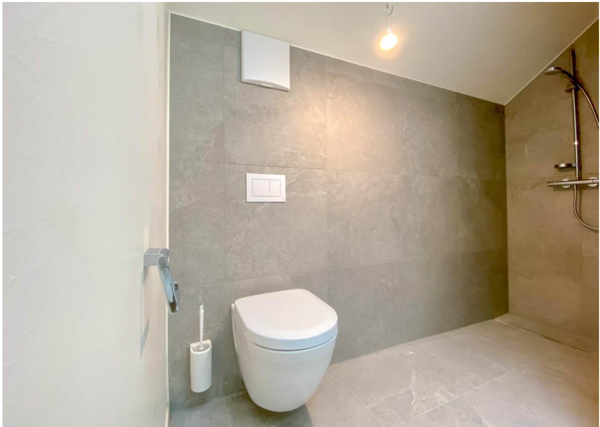
Zweites vollwertiges Badezimmer