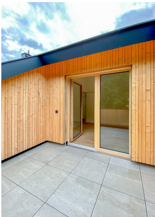
Mit separater Terrasse