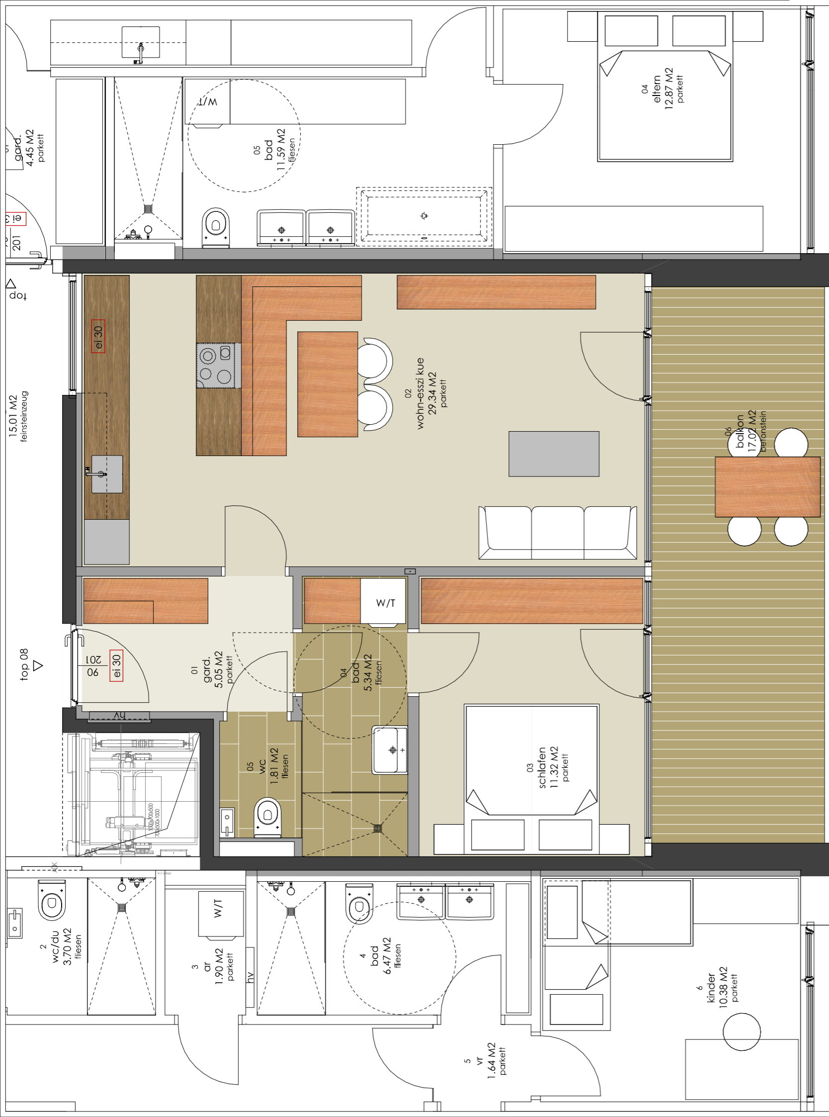
2-ZI WOHG. 52,86 M 2