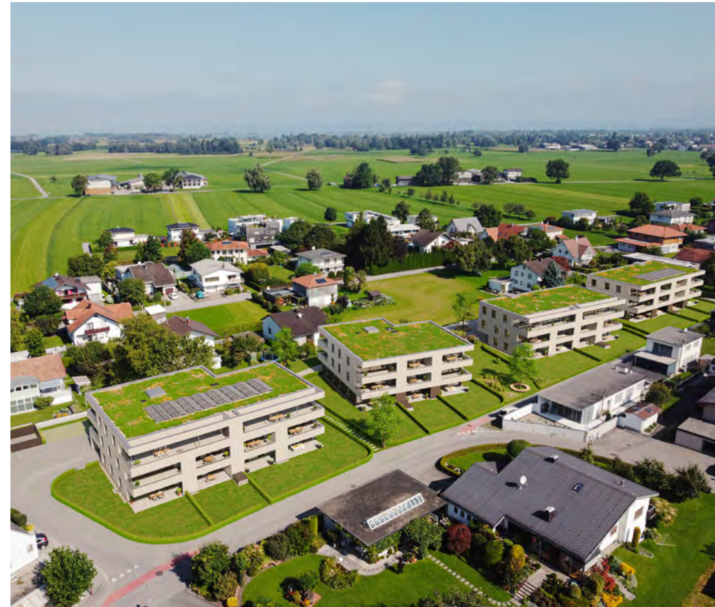
Ein besonderes Zuhause Schön geschnittene Grundrisse, südlich liegende Terrassen bzw. Loggien und Grünräume, die zum Verweilen einladen – das ist Wohnen in der Wohnanlage Wiesenstraße.

Huber ZT Kaiser-Franz-Josef-Straße 4a A-6890 Lustenau