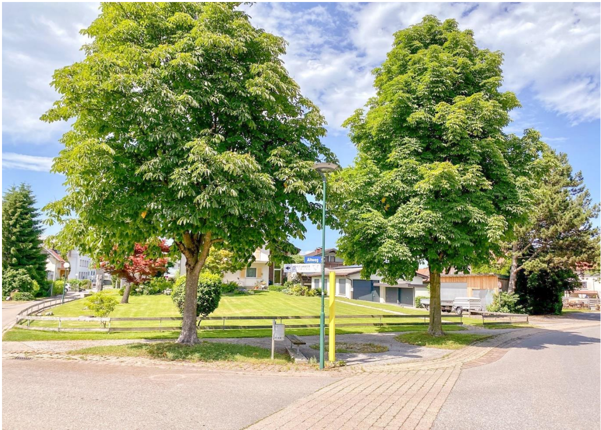
Bushaltestelle vor der Haustür