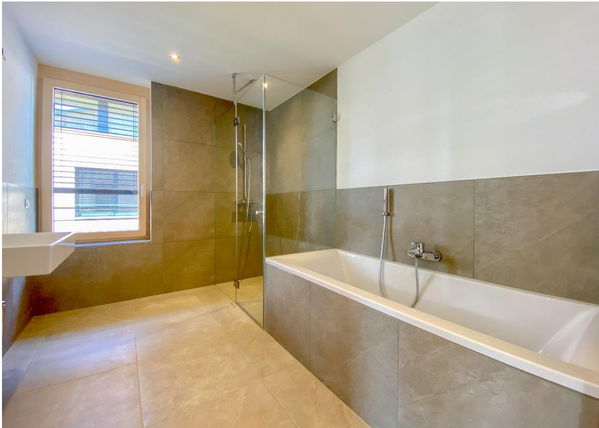
Badezimmer mit walk-in Dusche & Wanne