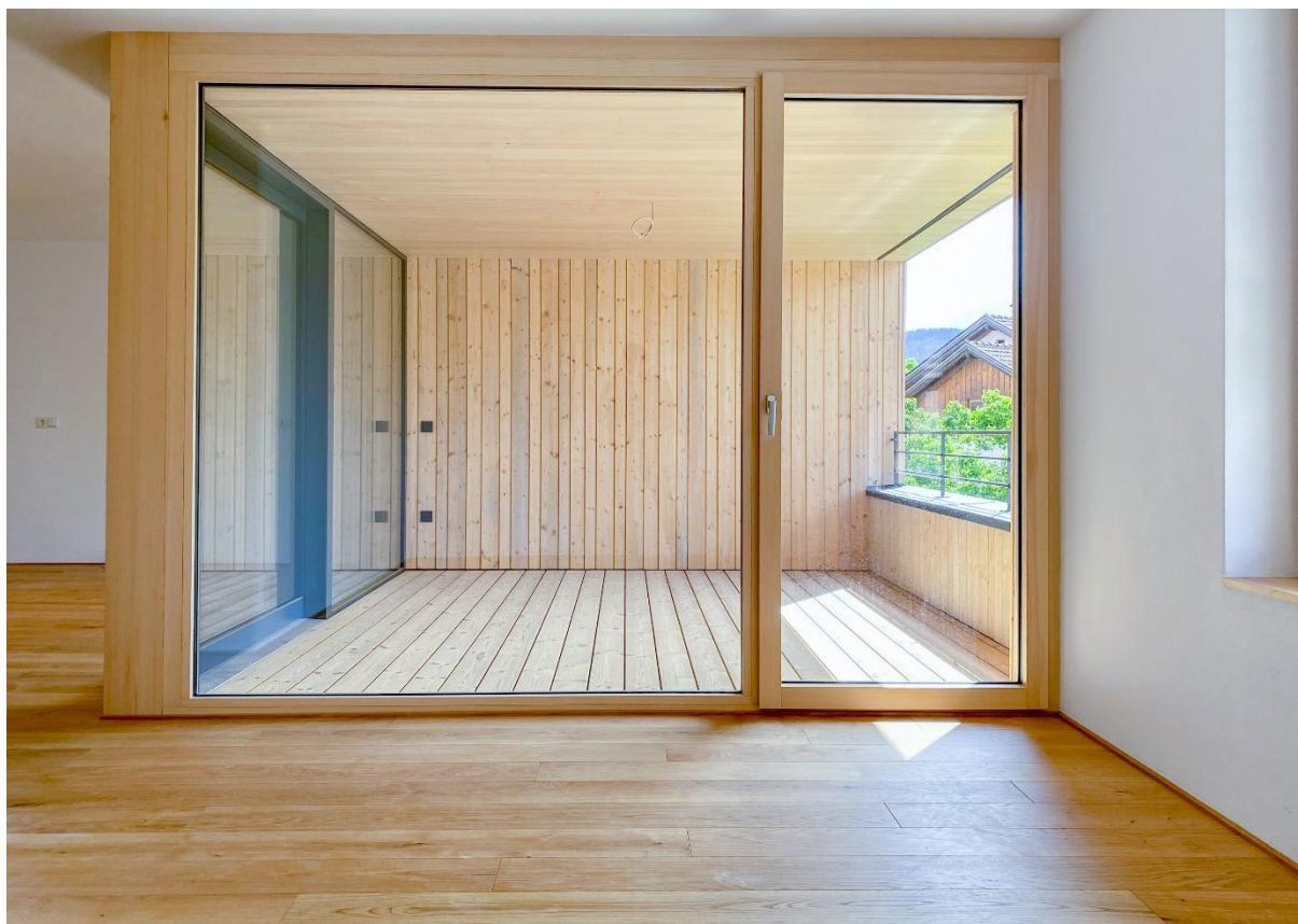
Zugang zur Terrasse