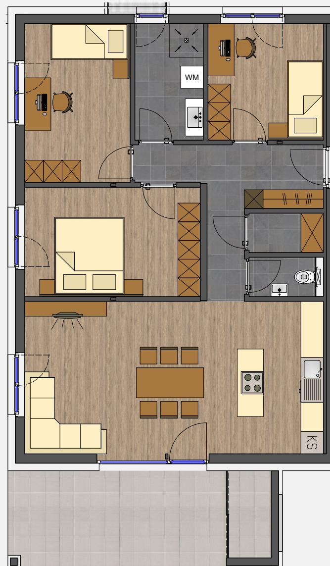
WOHNBEISPIEL M 1/100