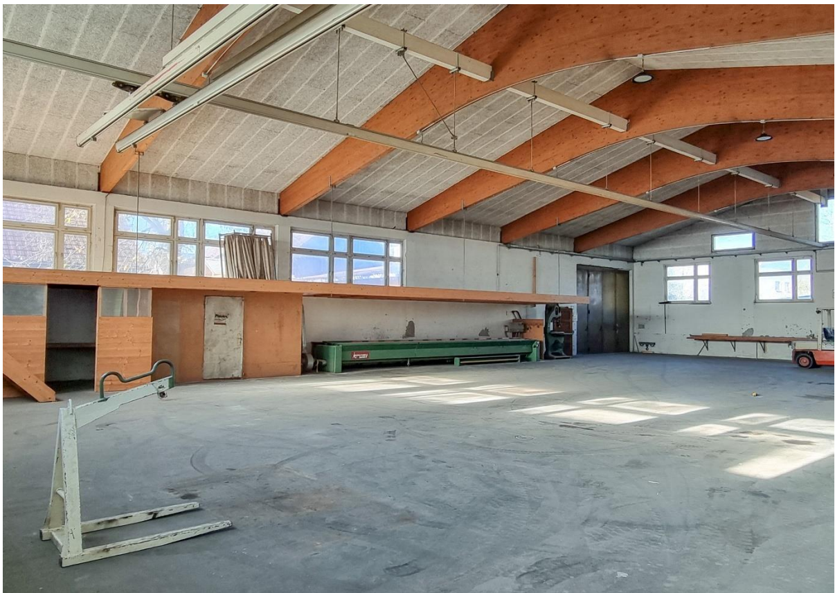
Innenansicht Halle mit Ausgang West