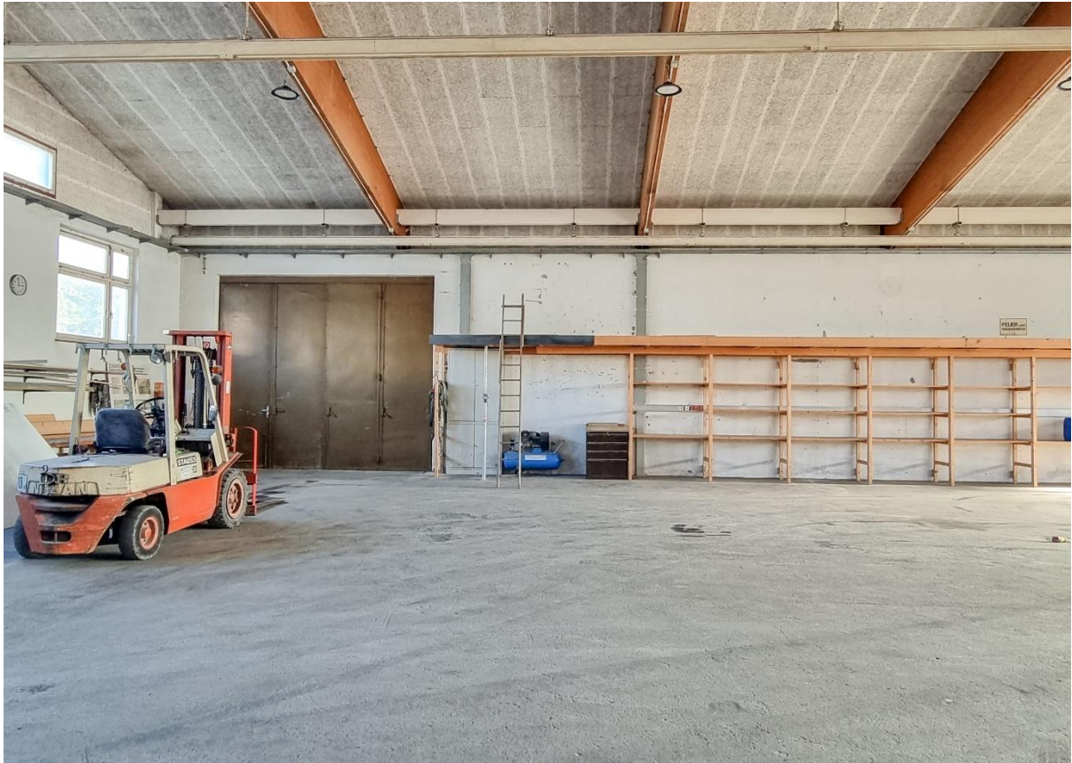
Innenansicht Halle mit Ausgang Ost