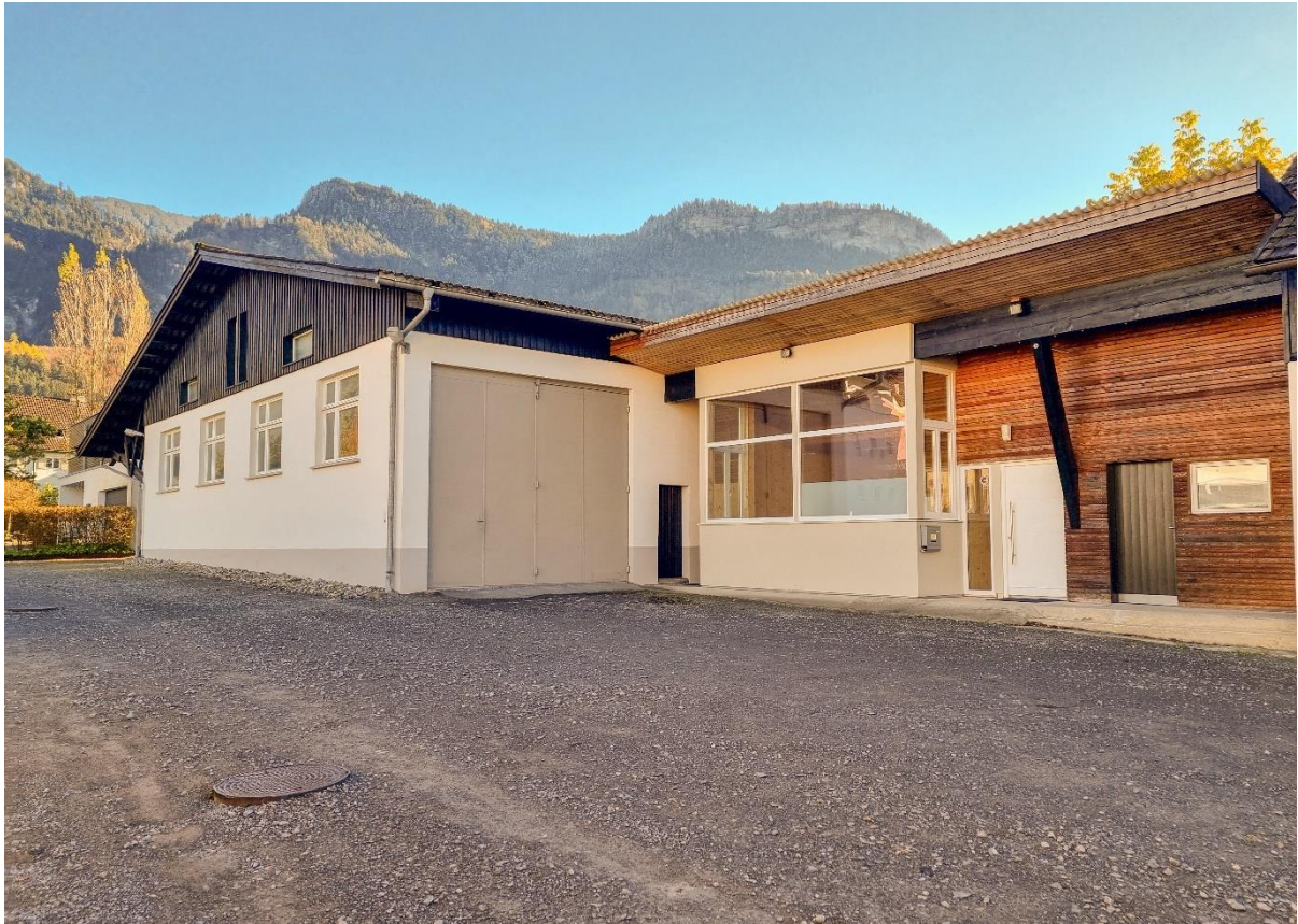
Ansicht West mit Abstellfläche / Parkfläche