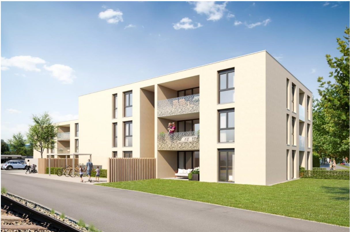
HAUS 1 LINKS – HAUS 2 RECHTS