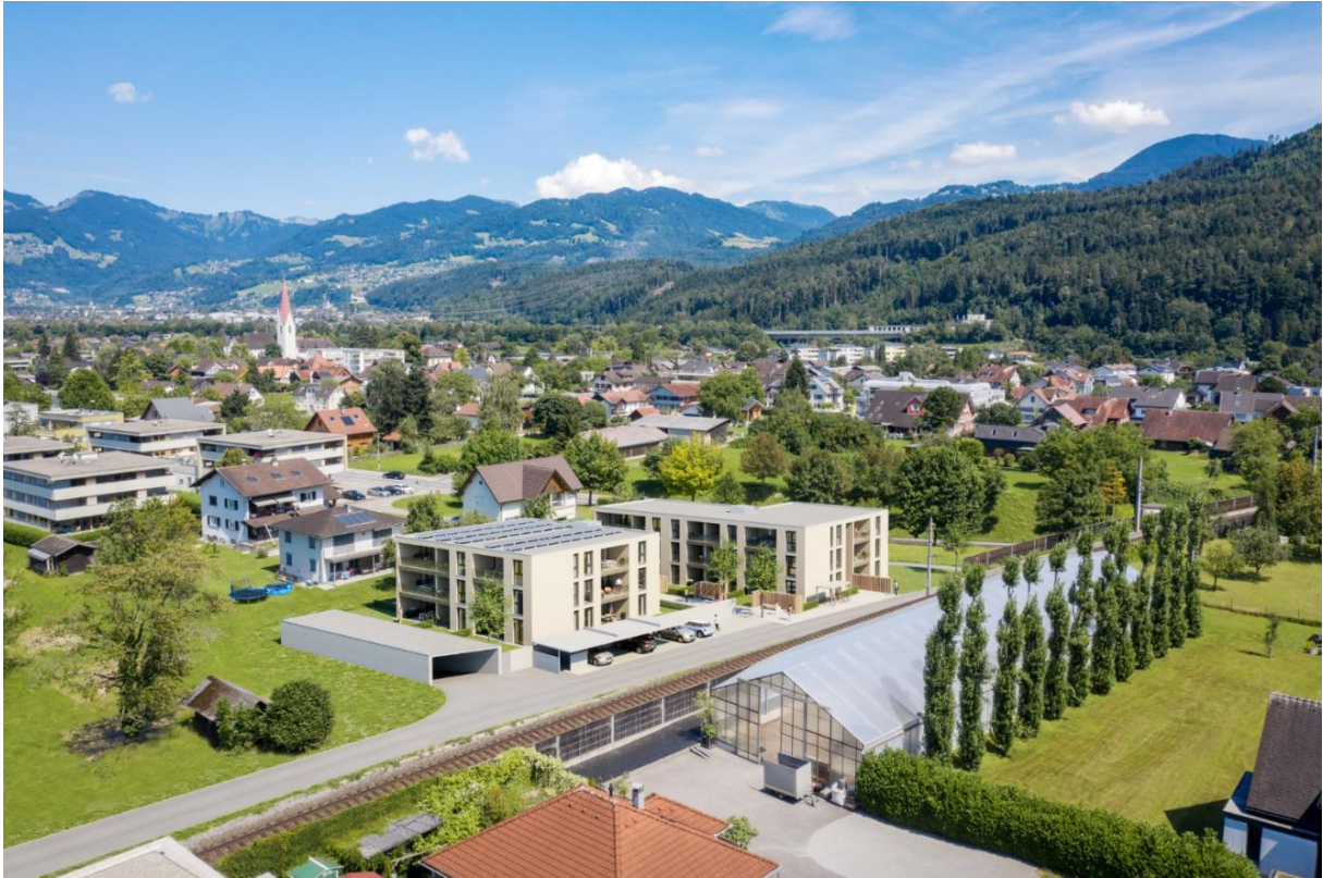
HAUS 1 LINKS – HAUS 2 RECHTS