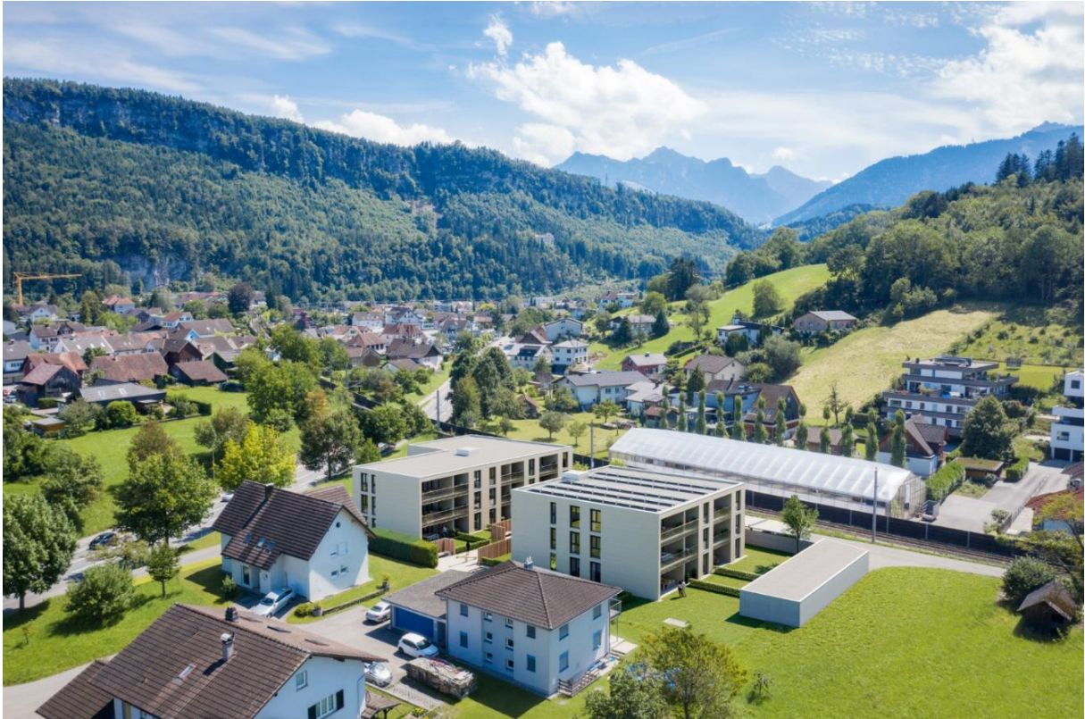
HAUS 2 LINKS – HAUS 1 RECHTS