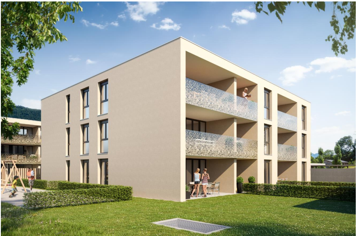
HAUS 2 LINKS – HAUS 1 RECHTS