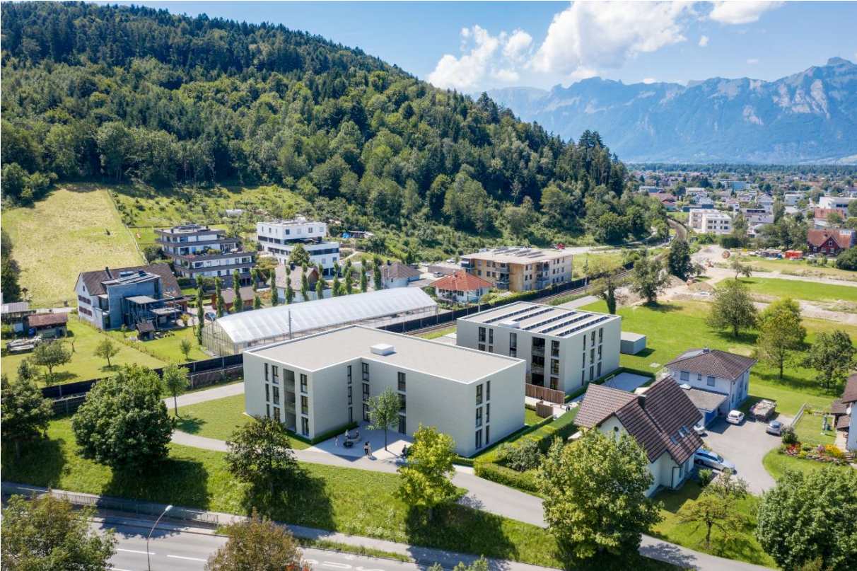
HAUS 2 LINKS – HAUS 1 RECHTS