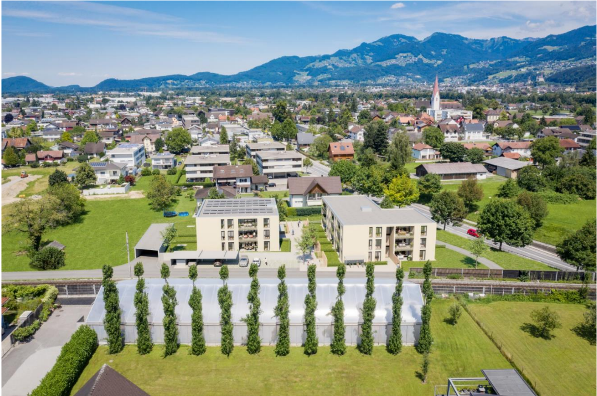
HAUS 1 LINKS – HAUS 2 RECHTS