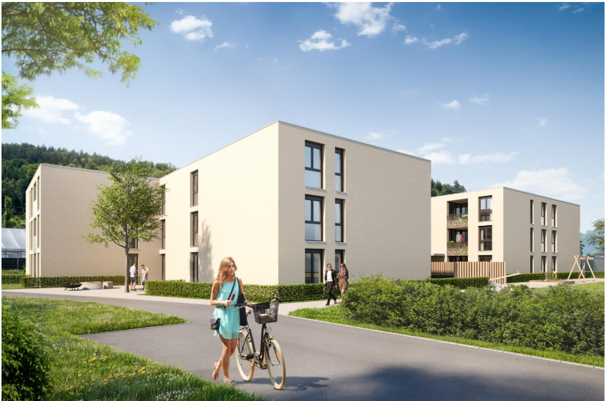
HAUS 2 LINKS – HAUS 1 RECHTS